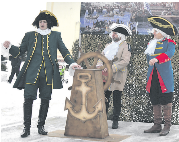
325 лет морскому флоту

325 лет исполнилось Российскому флоту. Эту дату с импровизированной сцены представил его основатель Пётр I. Великий реформатор, стремившийся «прорубить» окно в Европу, считал, что сделать это можно только благодаря созданию сильного флота, и сегодня мы можем гордиться военно-морской мощью России.