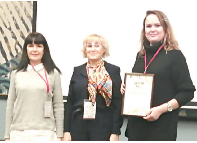
Представители Прохоровского района с наградой