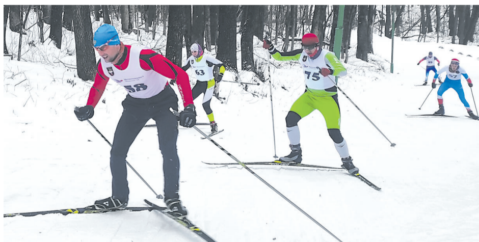
На лыжне развернулась упорная борьба за лидерство

Управление физической культуры, спорта и молодёжной политики.