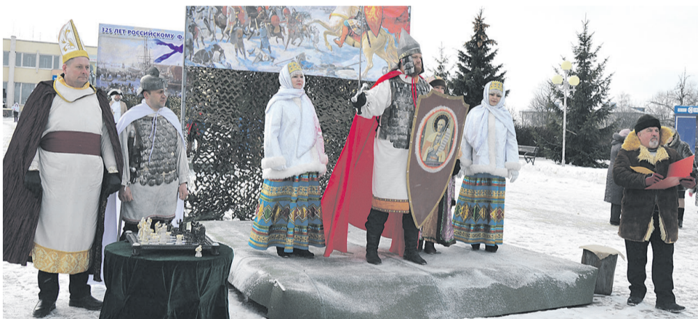
800-летие со дня рождения Александра Невского