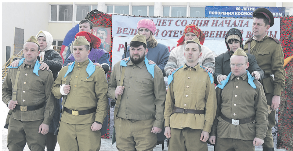
80 лет со дня начала Великой Отечественной войны

Самое трагическое событие XX века — 80 лет назад, в 1941 году началась Великая Отечественная война. Как и для всей страны, для прохоровцев это было тяжёлое, страшное время. Мужчины ушли на фронт, страдали те, кто остался дома, — дети, женщины и старики.