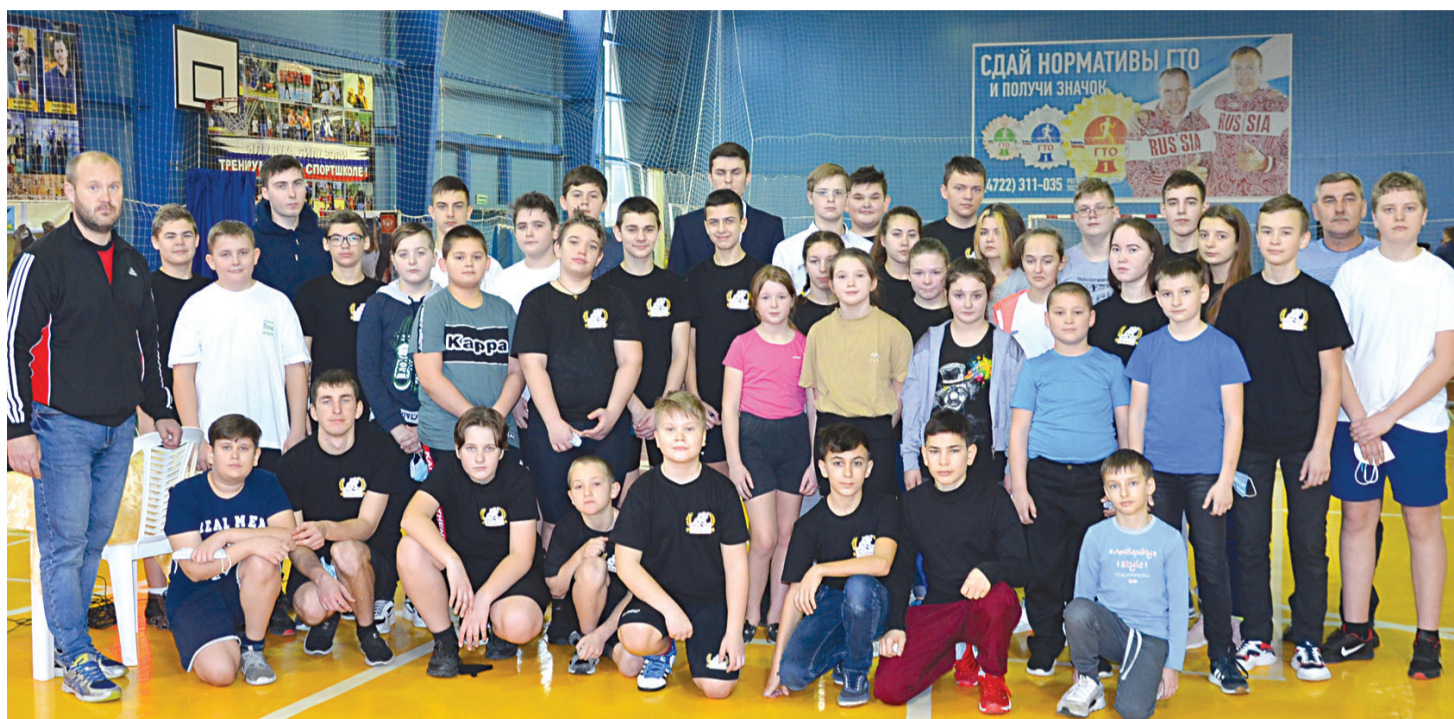
Большая и дружная команда прохоровских гиревиков с тренером перед выступлением на соревнованиях