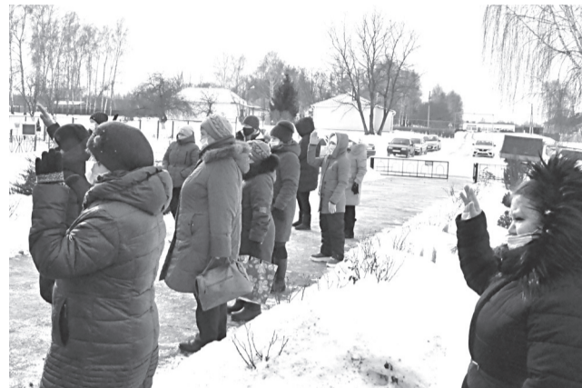
Жители с. Прелестное проголосовали за проект единогласно