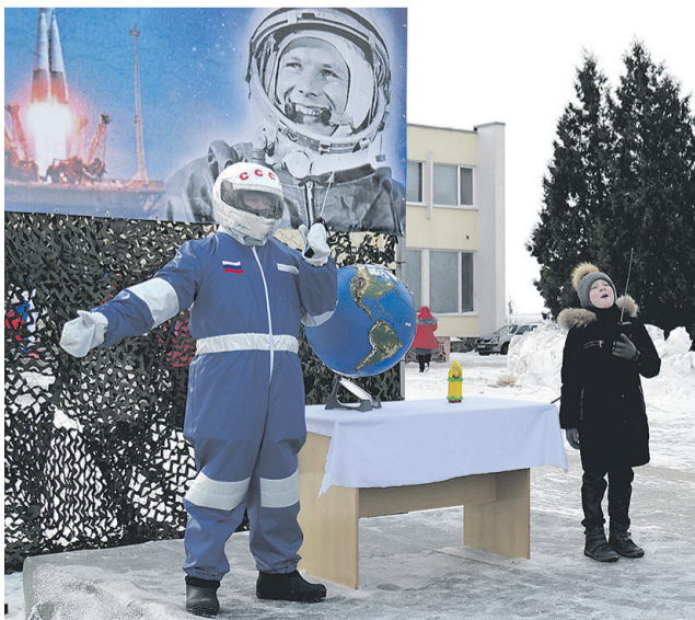
60 лет со дня первого полёта человека в космос