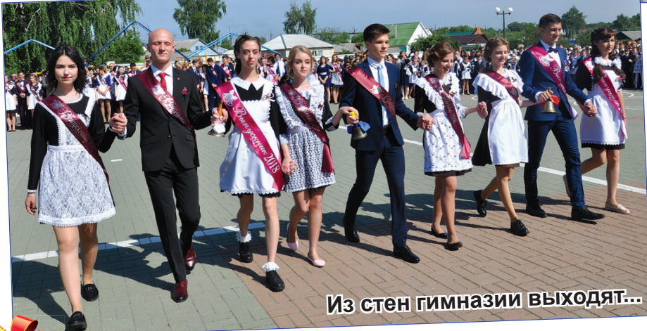
Из стен гимназии выходят...