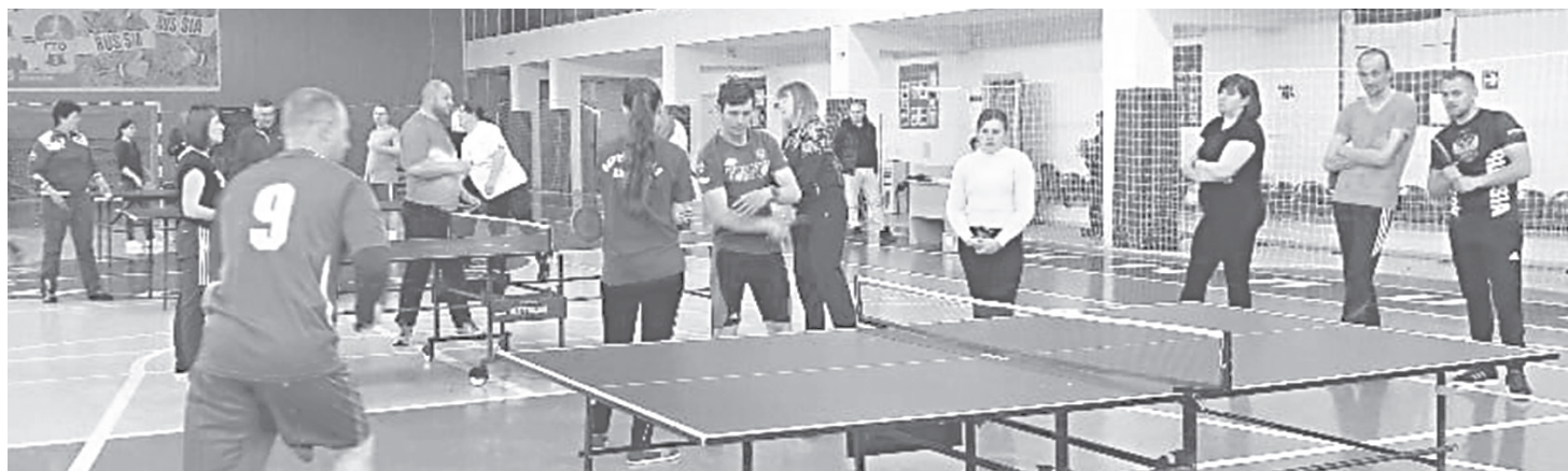
Самая главная ценность у каждого человека - это здоровье.

Ежегодно проводится спортивная спартакиада работников образования. В 2021-2022 учебном году в рамках Всероссийского Движения «Профсоюз - территория здоровья» и 6-й районной спартакиады работников образования 16 мая прошли соревнования по настольному теннису среди педагогических коллективов общеобразовательных организаций. В соревнованиях приняло участие более 32 человек. Представители команд - молодые педагоги и ветераны педагогического труда.