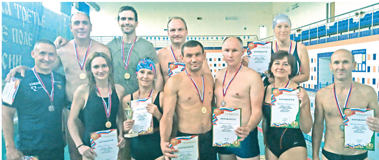
Призёры и победители соревнований по плаванию