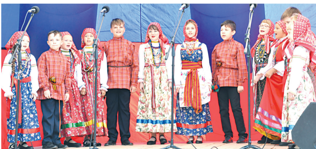
Яркие моменты фестиваля в Подольсках