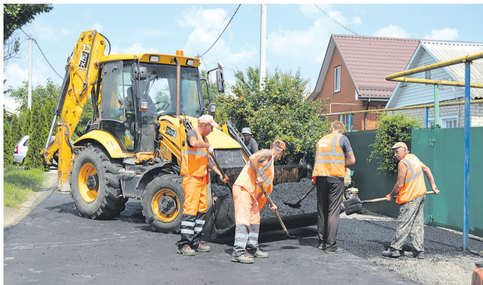
Бригада ООО «БелЗНАК» работает на улице 12 июля в Прохоровке

- Активно ведутся работы на улице 12 июля в Прохоровке, там идёт не только строительство твёрдого полотна, но и благоустройство территории - обустраиваются в асфальтобетоне подъезды к домовладениям. Сотрудники компании также проводят подготовительные работы под укладку асфальтобетона на улице Восточная. А на территории микрорайона «Олимпийский» идёт подготовка под благоустройство дороги и устройство тротуаров. Микрорайон «Олимпийский» включает в себя восемь участков, можно сказать, где уже проложено твёрдое покрытие, долговое для местных жителей. Начаты работы на участке дороги Холодное - Сетное - Хмелевое, окончить которые планируется в октябре. Пока завершена фрезеровка покрытия и восстановление основания методом холодной регенерации, далее будет уложено два слоя асфальтобетонного покрытия. Новый асфальт появится и на