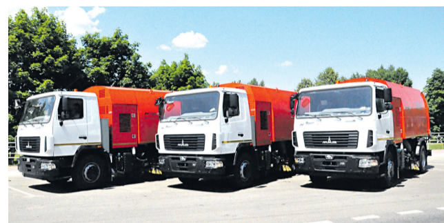
Поступившая в район коммунальная техника