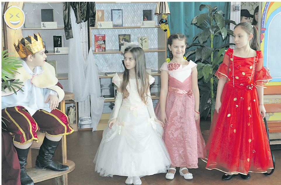
Юные театральные дарования демонстрируют свои таланты