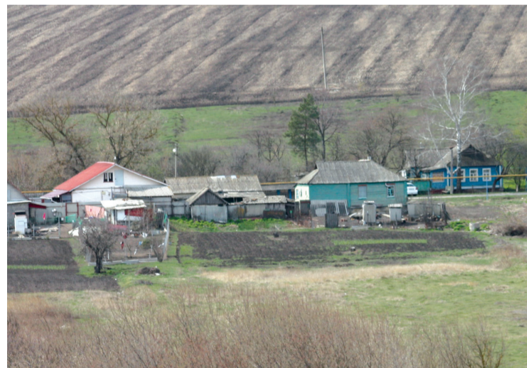
Вот моя деревня...

Пейзаж — пожалуй, один из любимейших жанров фотографии. Его популярность несложно понять, потому как у людей появляется возможность провести время на открытом воздухе наедине с природой. Где бы мы ни находились, на отдыхе или на работе, в своем селе или за его пределами, везде присутствует она — природа — потрясающее естественное пространство, способное менять форму, содержание и цвет ежеминутно, изо дня в день, круглый год, на протяжении тысячелетий.