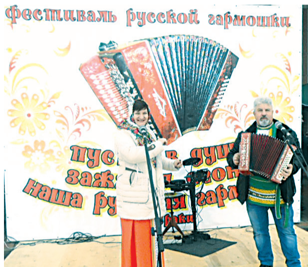
Гармонист и частушечница

Частушки — это не просто тексты, это поэтическая крупинка народной мудрости, жемчужинка таланта народа; миниатюрная картинка, запечатлевшая частичку нашего быта, движение человеческой души, проявление какого-то чувства или пусть даже небольшой штришок к портрету лирического героя. За ними стоят живые исполнители, яркие личности. Их жизненный опыт не должен уйти.