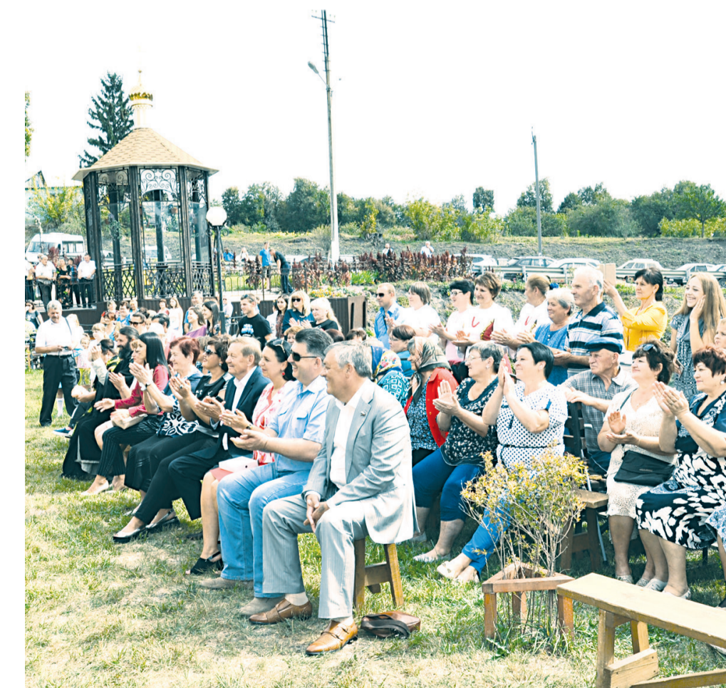
На открытии парка «Барский источник»