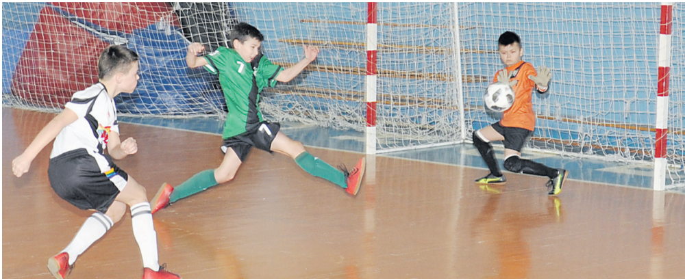
Опасный момент у ворот