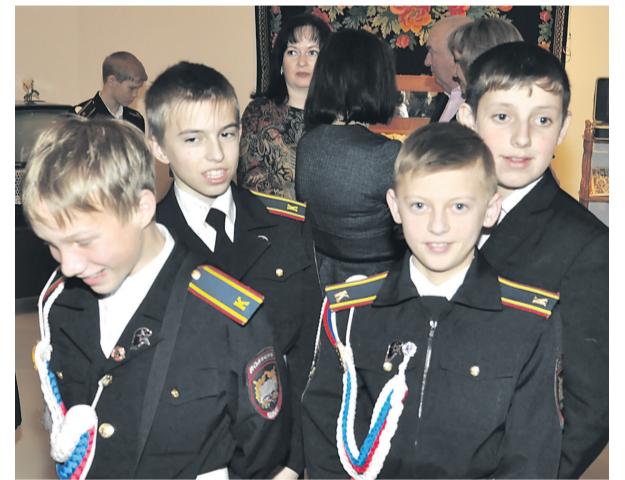
Экскурсанты на выставке