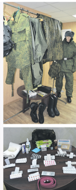
Образцы экипировки белгородских мобилизованных: форма и аптечка

У вас есть новость? Вы обладаете интересной информацией или стали очевидцем необычного? Звоните 2-18-41, 2-16-97 Пишите istoki.gaz.proh@yandex.ru