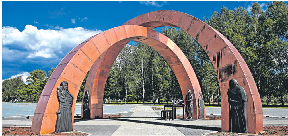
Мемориал «Перекрёсток памяти»

Беседовала О. МАМЕДСААТОВА.