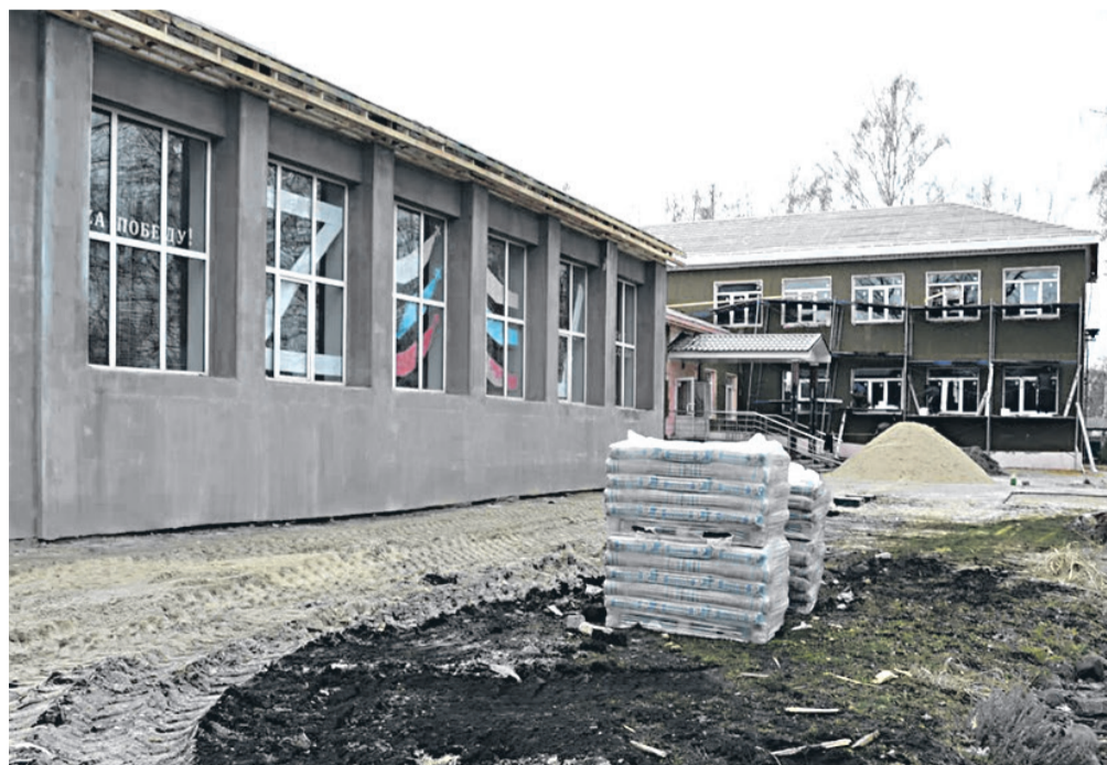
Капитальный ремонт МБОУ «Прелестненская СОШ»