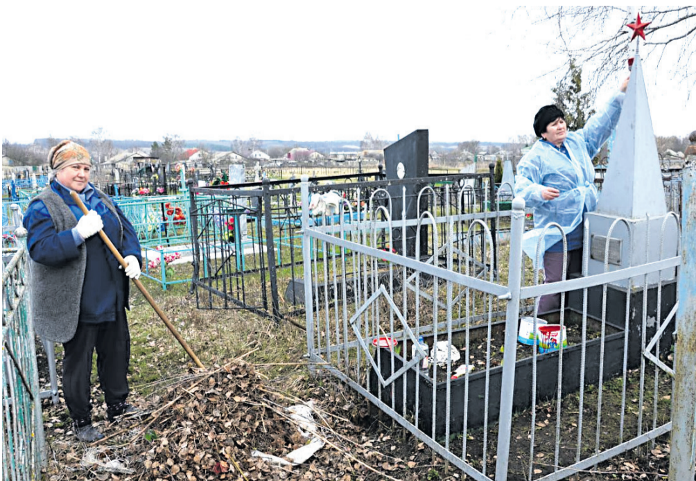
Наведение порядка на гражданском кладбище