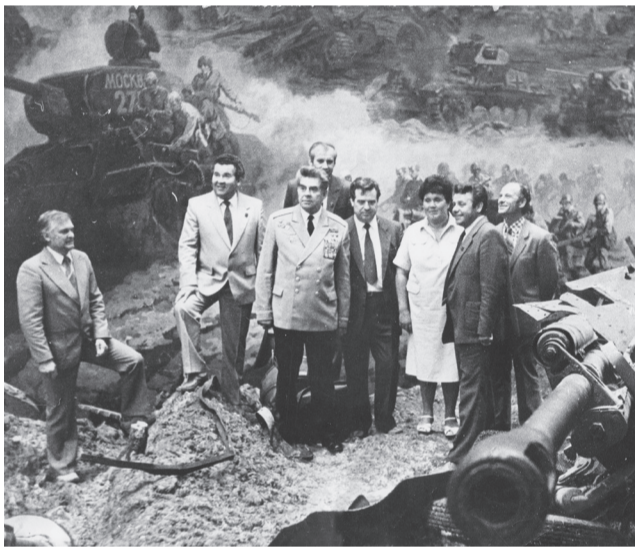
Г.Т. Береговой (в центре) в Белгородской диораме

Вот какую картину он наблюдал и сам её «рисовал» на Курско-Белгородском направлении в июле 1943 года: «В небе, загаженном гарью и дымом, становилось тесно. Оно буквально кишело нашей и вражеской авиацией. Повсюду завязывались короткие воздушные бои. То тут, то там стремительно пронеслись в них факелы охваченных пламенем самолётов. Горели фашисты и наши. Рубка шла на смерть. Схватки протекали коротко и жёстко: дрались на встречных курсах, крутых виражах, на молниеносных ата-