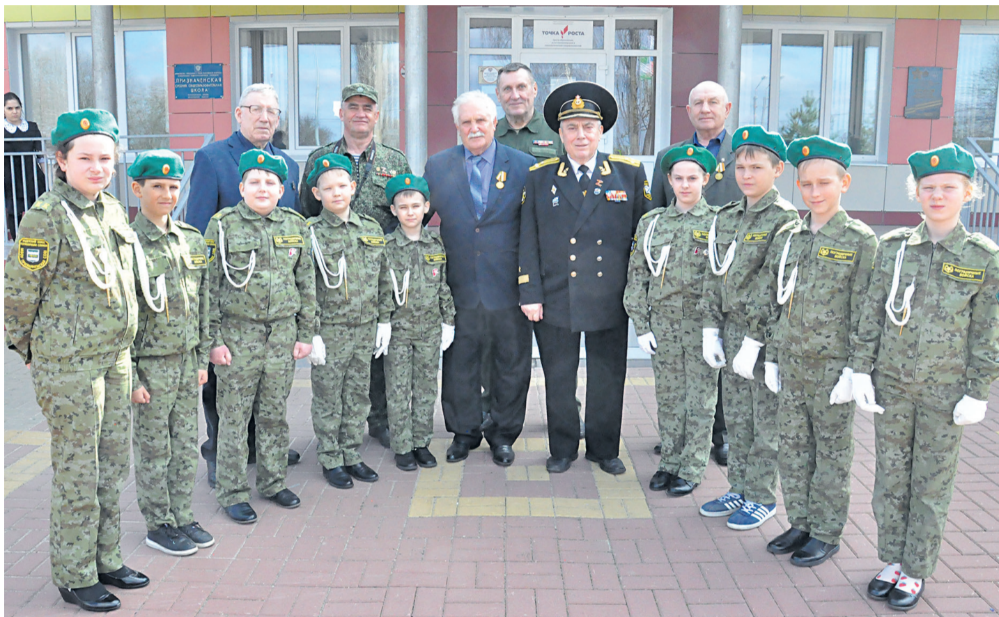
Гости Призначенской СОШ с кадетами-пограничниками