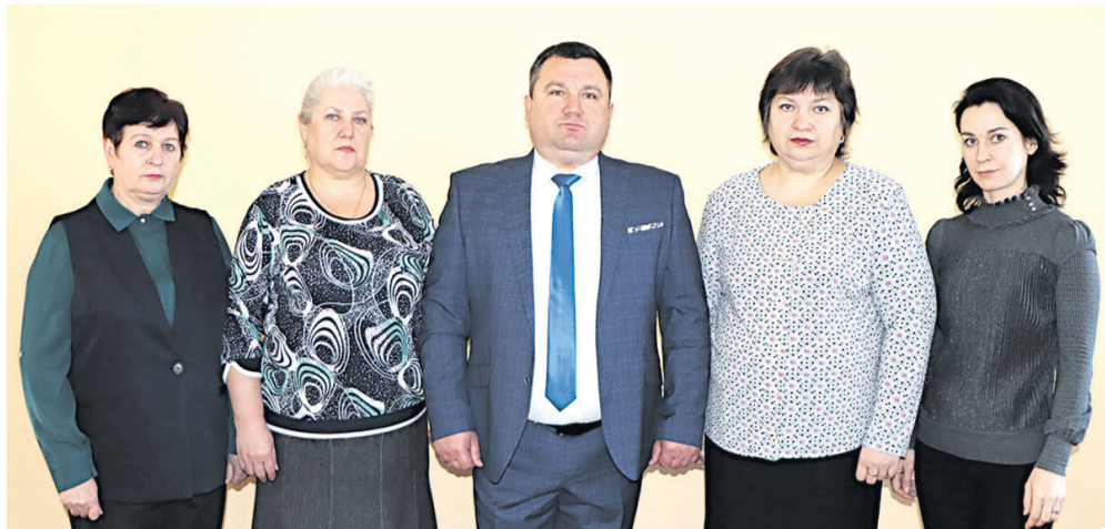
Коллектив администрации Прелестненского сельского поселения

рамках губернаторской программы смогли решить вопрос качественной и чистой питьевой воды для нашего населения. Это большая тема для жителей всей Белгородской области и Прохоровского района в том числе.