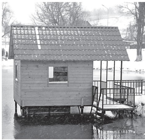
Купель на истоке реки Северский Донец в с. Подольхи

мальное безопасное учащенное дыхание. Как только ваше тело приспособилось к холоду: