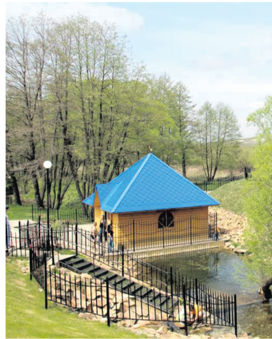
Источник и часовня в Парке регионального значения