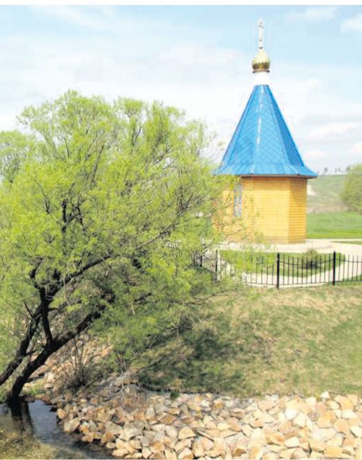
«Ключи», бывшая земля помещика Питры