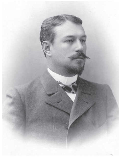
Константин Альбертович Питра, около 1905 года

Карьерный рост Константина Питры, обеспеченный высоким общественным статусом и протекционизмом тестя, складывается весьма успешно. В период с 14 февраля 1895 года по 21 января 1901 года Константин два срока занимает должность предводителя дворянства Ростовского округа и получает первую награду - орден Святого Станислава 2-й степени, пожалованный ему 20 января 1898 года.