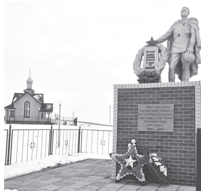
Памятник воинской славы у братской могилы в с. Кривошеевке