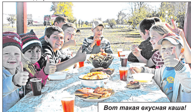
Вот такая вкусная каша!