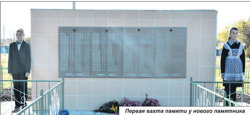
Первая вахта памяти у нового памятника

Ведущие от имени всех жителей сёл Сагайдачное и Боброво выразили искреннюю благодарность всем, кто помог увековечить память о воинах, павших в боях за Родину. Имена 167 воинов высечены на стене. Впервые в селе появилось место, которое будет хранить память о тяжелых днях войны, куда молодое поколение будет приносить цветы в Дни Великой Победы и Дни памяти и скорби.