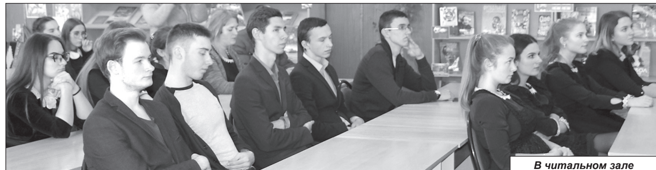
В читальном зале