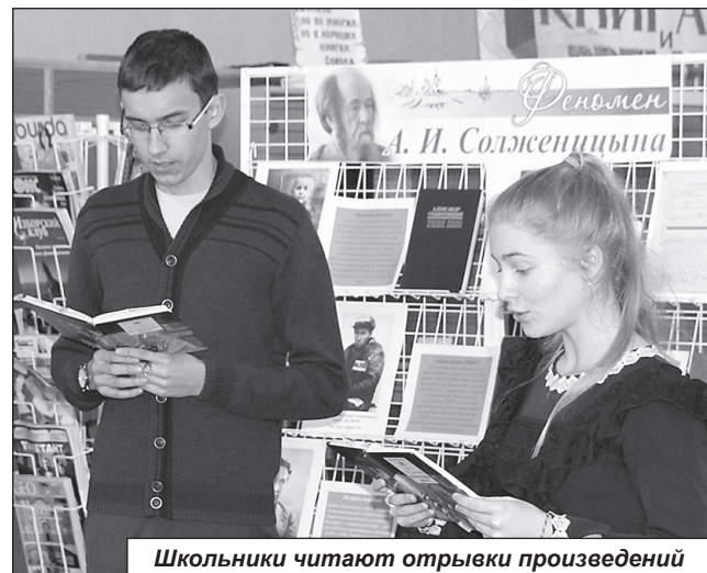
Школьники читают отрывки произведений

В 1961 году под впечатлением от выступления Александра Твардовского, в то время занимавшего пост редактора журнала «Новый мир», на XXII съезде КПСС, Солженицын передал ему рассказ «Щ-854», изъяв откуда заведомо не проходящие через советскую цензуру фрагменты. Твардовский, высоко оценивший рассказ, пригласил автора в Москву и стал добиваться публикации произведения. Н.С. Хрущёв пре-