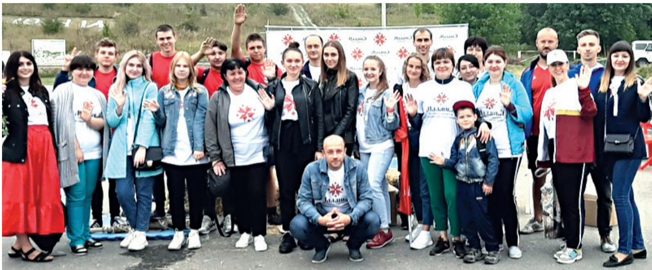
Волонтеры Фестиваля исторических реконструкций «Маланья»