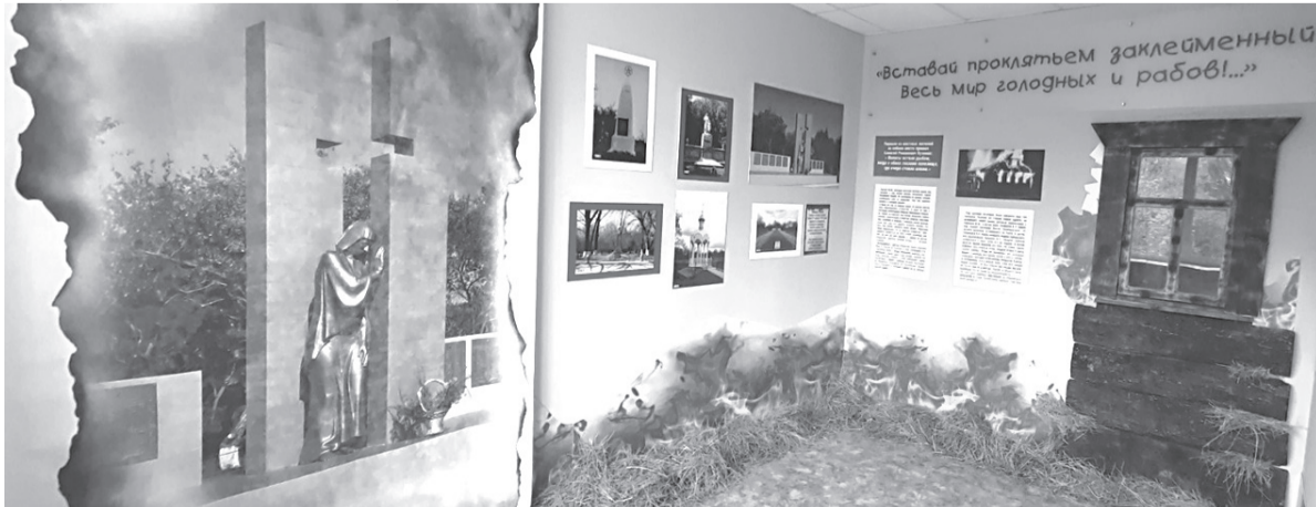
Фрагмент из экспозиции музея в Призначенской средней основной школе