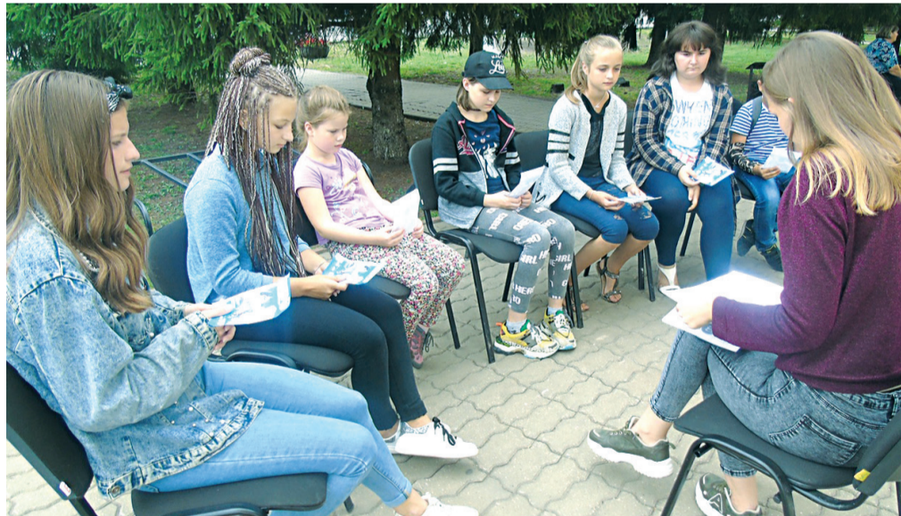
Ежемесячная школа добровольцев Прохоровского района