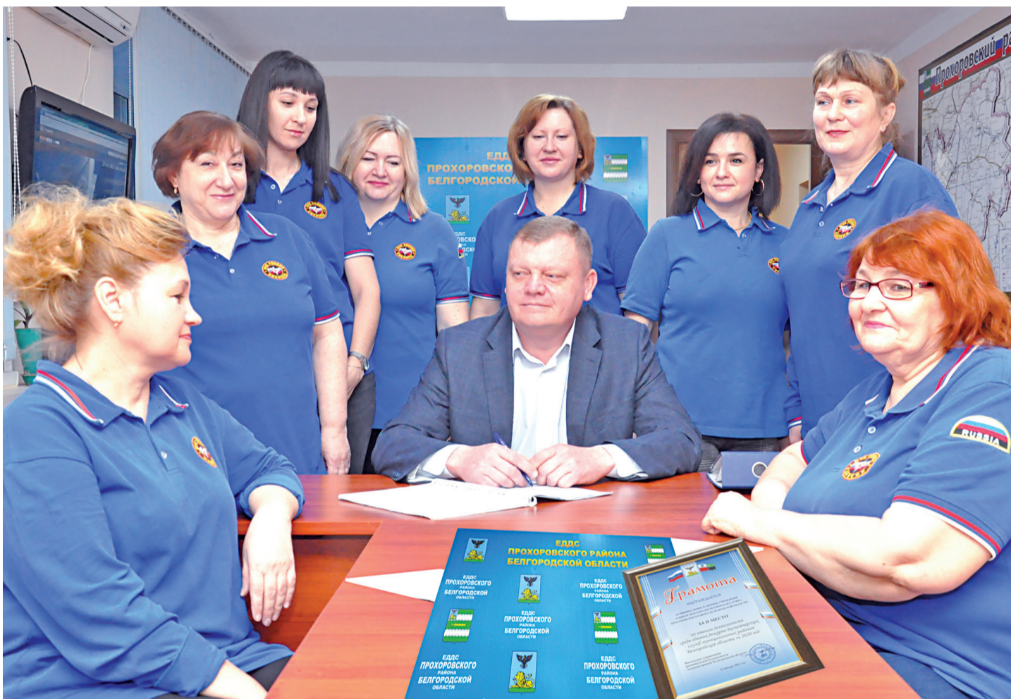
Дружный коллектив ЕДДС обсуждает планы работы на текущий день