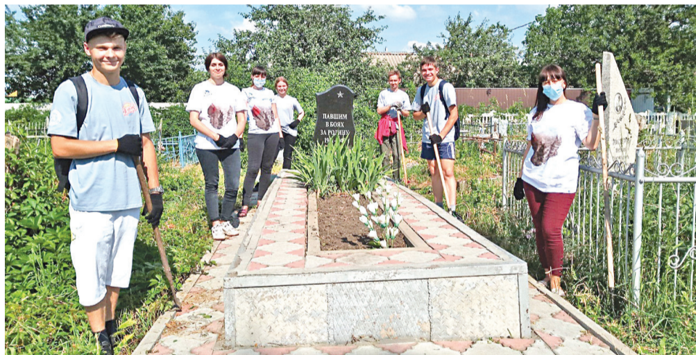
Международный субботник по благоустройству памятных мест и воинских захоронений