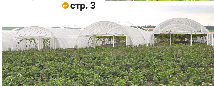
Теплицы и урожай винограда

У вас есть новость? Вы обладаете интересной информацией или стали очевидцем необычного? Звоните 2-18-41, 2-16-97 Пишите istoki.gaz.proh@yandex.ru