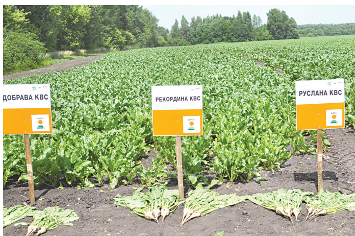
Свёкла в «Славянском»