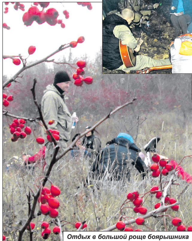
Отдых в большой роще боярышника

кой сухой траве правого берега реки Псёл. На такие вопросы я неизменно отвечала: «Сегодня». Потом на пути появился одинокий домик, а вот уже и знакомая дорога к пляжу у пруда парка «Ключи». Вот здесь у многих наконец-то открылось второе дыхание: на подъеме сил мы заторопились к месту окончательной стоянки. И опять потрясение: знакомой тропинки нет, везде завалы из упавших деревьев. Как же мы были счастливы, когда пробившись сквозь заросли, обнаружили место нашего быв-