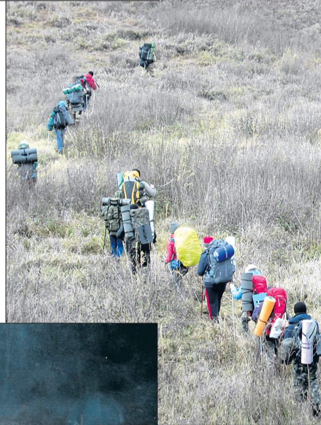
Первый высокий подъем