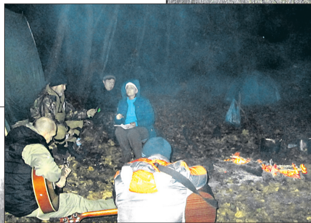
Туристический костёр – это традиция и высокий смысл общения

кой сухой траве правого берега реки Псёл. На такие вопросы я неизменно отвечала: «Сегодня». Потом на пути появился одинокий домик, а вот уже и знакомая дорога к пляжу у пруда парка «Ключи». Вот здесь у многих наконец-то открылось второе дыхание: на подъеме сил мы заторопились к месту окончательной стоянки. И опять потрясение: знакомой тропинки нет, везде завалы из упавших деревьев. Как же мы были счастливы, когда пробившись сквозь заросли, обнаружили место нашего быв-