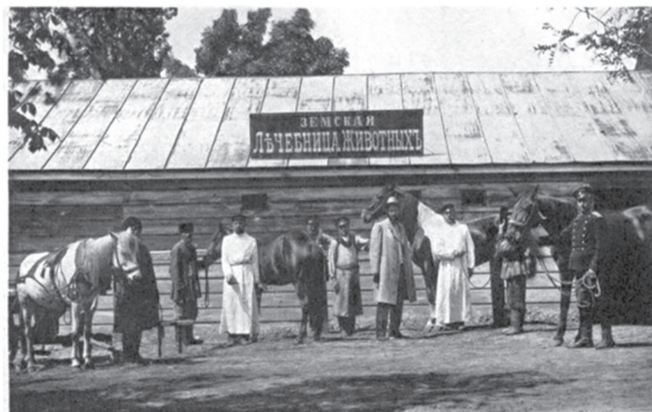
Лечебница животных в г. Короча.

Корочанская ветлечебница конец XIX - начало XX века