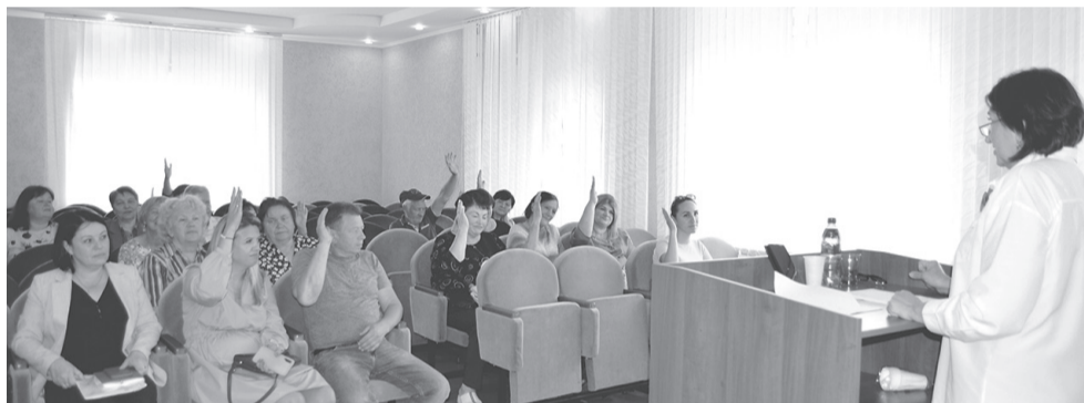
Отчёт председателя местного отделения «Красного креста»