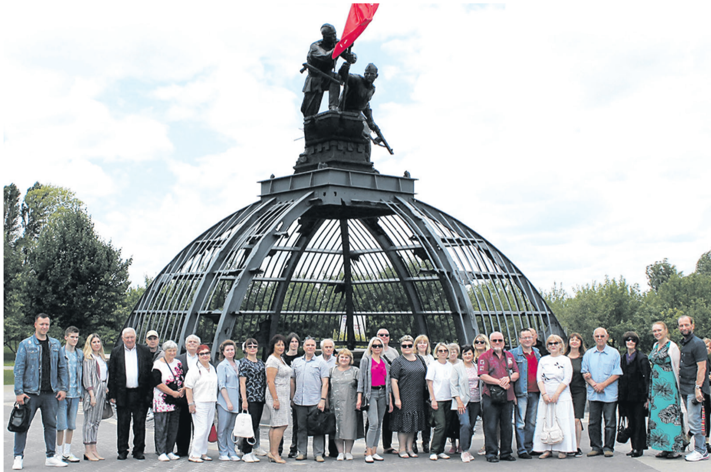
Участники поэтических чтений