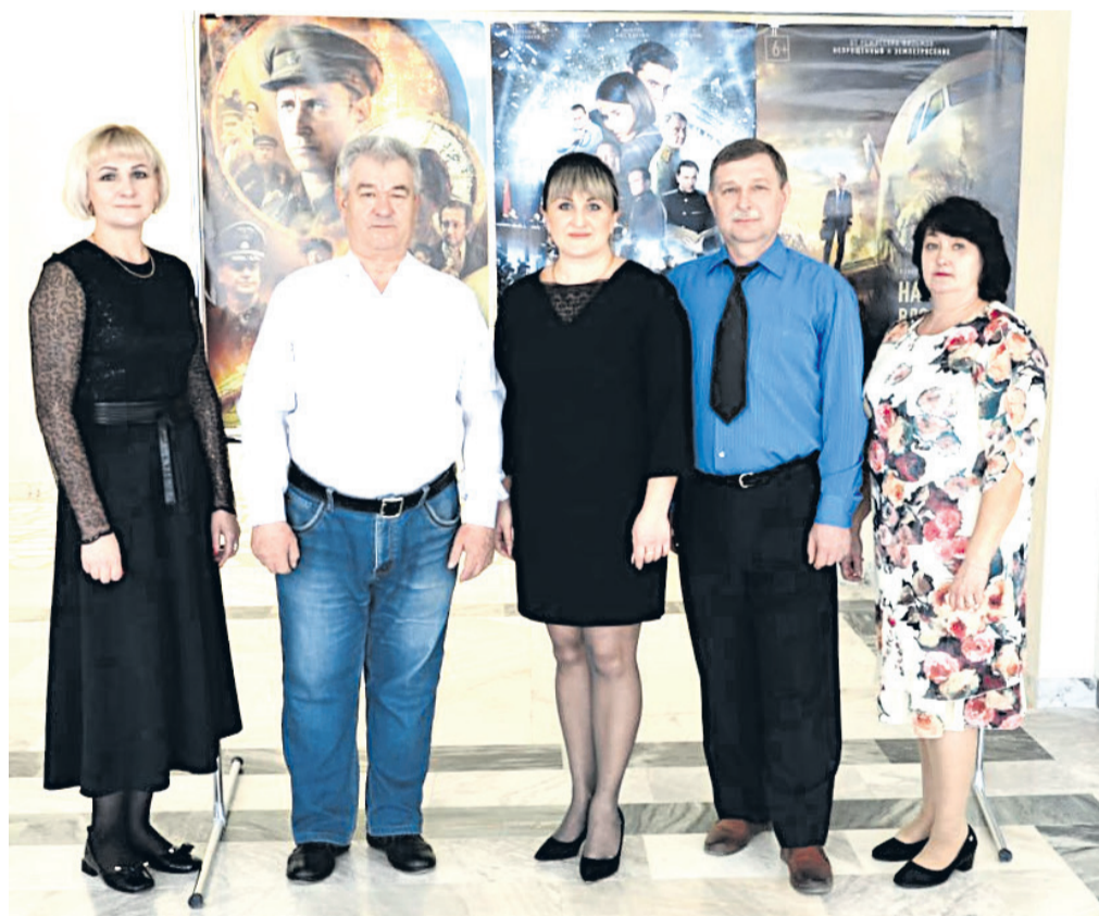
Коллектив кинотеатра «Звёздный»