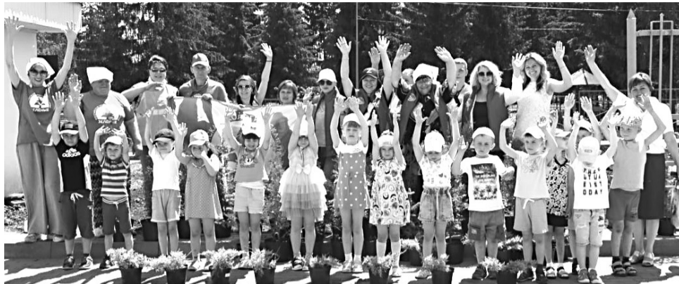
Участники акции «Зелёный перегон»

Сквер из хвойных деревьев и кустарников появится в ближайшее время на территории железнодорожной станции «Прохоровка». Его местоположение утвердили на минувшей неделе сотрудники РЖД и активисты российской экологической партии «Зелёные».