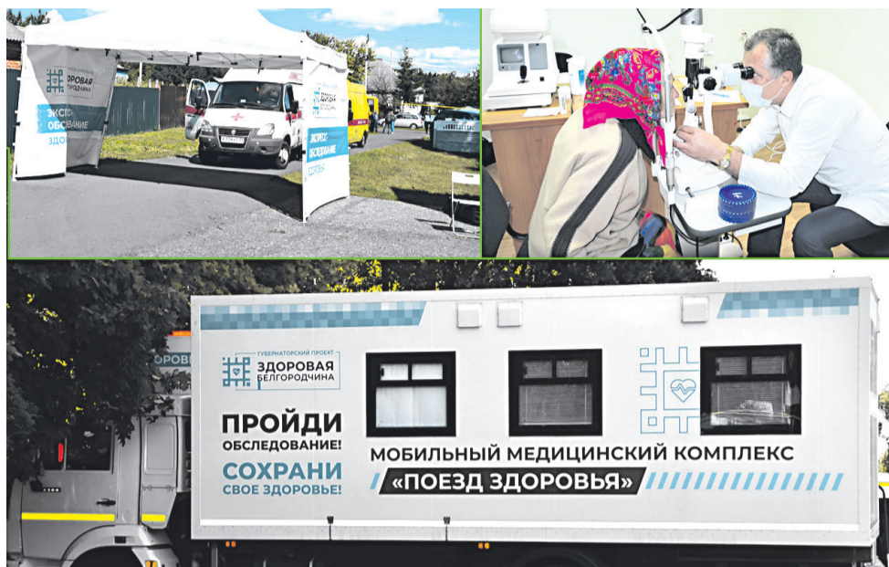
«Поезд здоровья» в Прохоровском районе

Помимо прочего, Белгородская область приобрела 4 «поезда здоровья», в каждом из которых есть набор современного диагностического оборудования. Эти мобильные медицинские комплексы помогают проводить комплексные диагностические