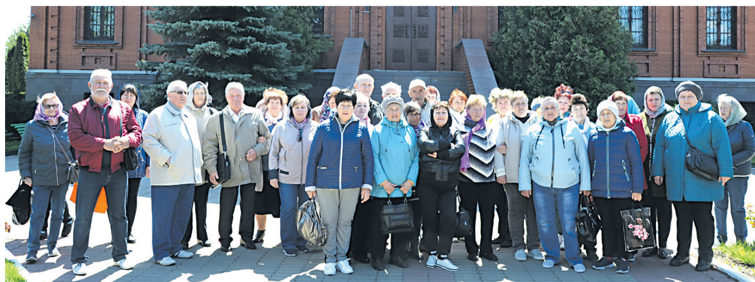
Прохоровцы в гостях в Губкинском районе

В целом, по докладу губернатора можно увидеть, что регион не стоит на месте, динамично развивается. Этому не смогли помешать ни пандемия, ни санкции, ни другие проблемы, а Белгородская область сегодня занимает лидирующие позиции во многих сферах не только в Черноземье, но и в России».