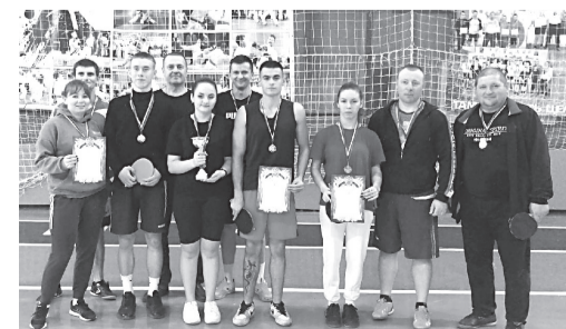
Победители соревнований по настольному теннису - одному из видов районной спартакиады