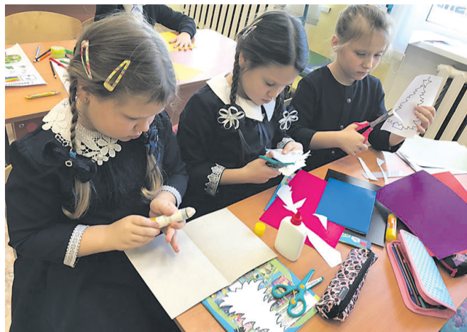
Ученики Ржавецкой школы

Также обучающиеся и воспитанники образовательных учреждений Прохоровского района изготавливают новогодние открытки военнослужащим, выполняющим боевые задачи.