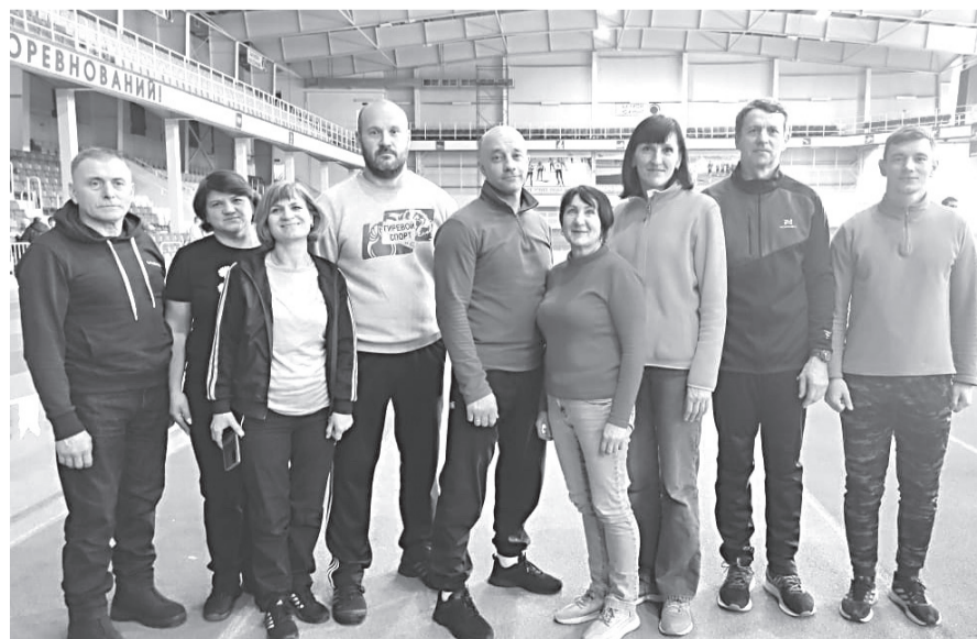
Прохоровцы на областных соревнованиях ГТО

Соперниками Прохоровской команды стали сборные из посёлков Борисовка и Красная Яруга, городов Грайворон и Короча. В ходе упорной борьбы наши футболисты заняли второе место и вышли в финальный этап спартакиады.