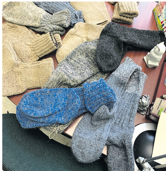
Тёплые носки для солдат