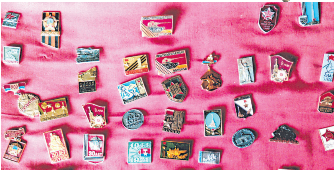
Города - герои и города воинской славы

Значки героев гражданской войны в наборе: Щорс, Чапаев, Фрунзе, Киров, Котовский, Ворошилов. Наши современники здесь - герои космоса: Ю. Гагарин, В. Терешкова, С. Королёв.