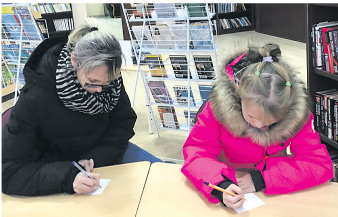
Читатели библиотеки Н.И. Рыжкова