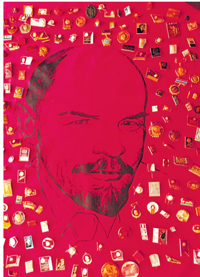
Значки, посвящённые жизни и труду В.И. Ленина

Чем ещё одарила нас Советская власть? Различными обществами. Перечислю: Освод - спасение на водах, охрана памятников, общество санинспекторов, юных пожарных, охрана природы, спортивное общество «Урожай», все эти значки - для того, чтобы юное поколение помогало поколению старшему. Как это было разумно придумано! Среди этой коллекции - самый красивый значок «Дружинник». Он выдавался взрослым (в основном комсомольцам), добровольцам, которые по вечерам дежурили по посёлку, по городу и следили, чтобы спокойствие царило в парках, на танцплощадках, в клубах. Это дежурство считалось почётным: на рукаве - красная повязка, на груди - значок «Дружинник».