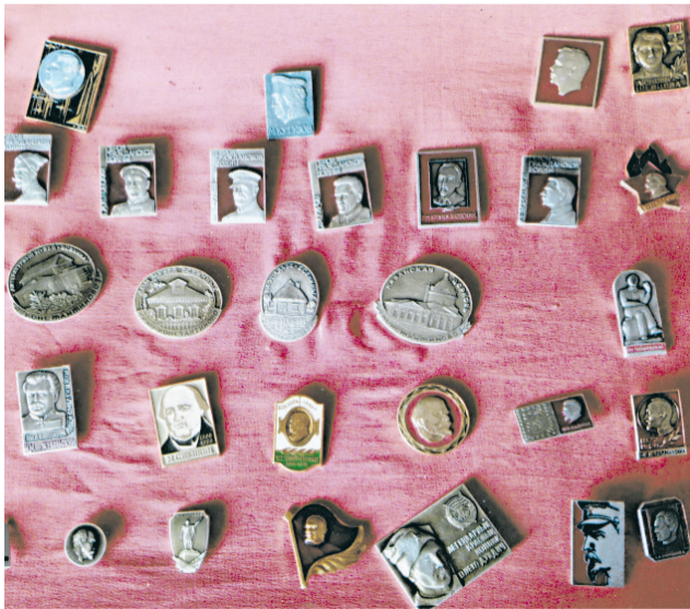
Они прославили нашу Родину: участники Гражданской войны, космонавты, писатели и поэты

ВНИМАНИЕ! Подать объявление и оформить подписку вы можете у нас на сайте http://prohistoki.ru