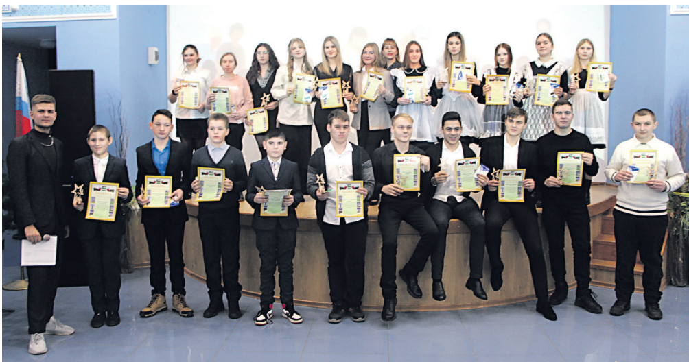
Участники волонтерского движения образовательных учреждений района