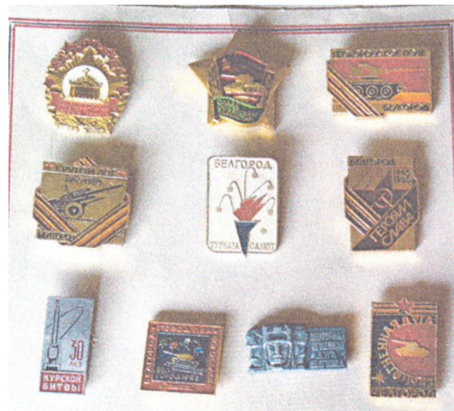
Значки, посвящённые г. Белгороду

Ветеран педагогического труда, член Союза журналистов России.