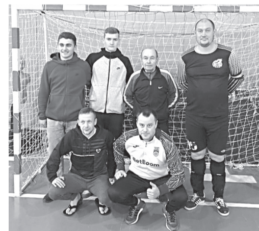
Прохоровская команда по мини-футболу