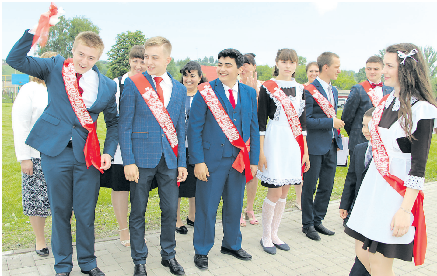
Последний звонок для выпускников Береговской средней школы