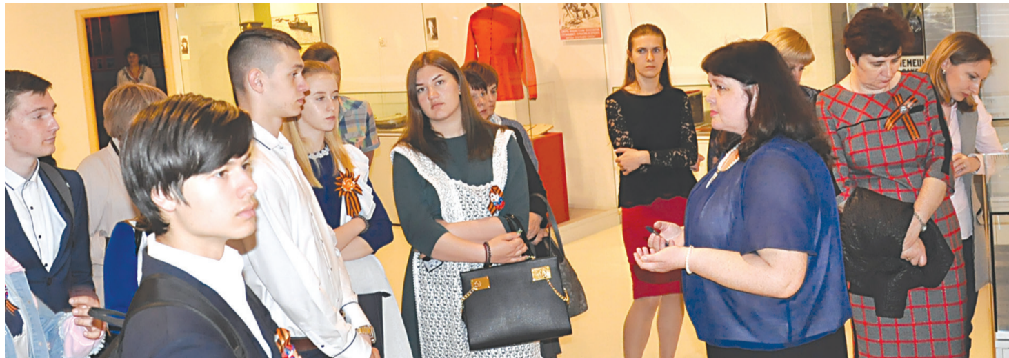
Во время экскурсии

Специалист управления образования администрации Прохоровского района.