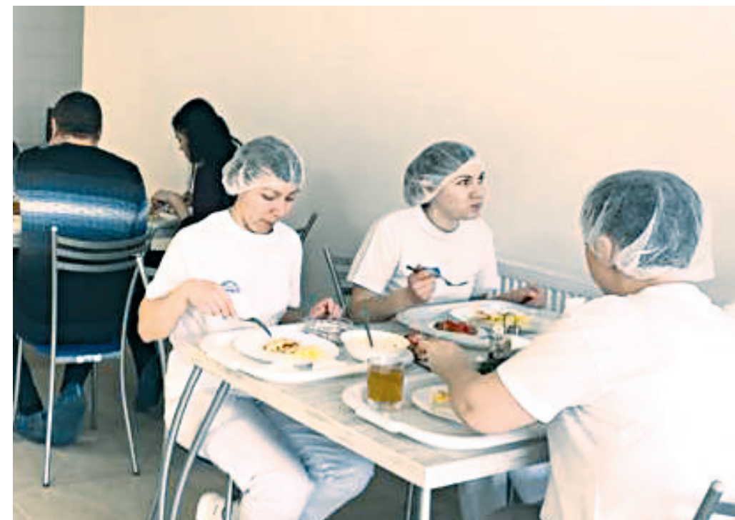
В новой столовой...

ков завода увеличилась на 178 человек, и сегодня работающих здесь 356, специалистов предприятие продолжает активно на работу приглашать. Средний уровень заработной платы на предприятии за минувший год составил 40 тысяч рублей, что намного выше средне районного показателя.