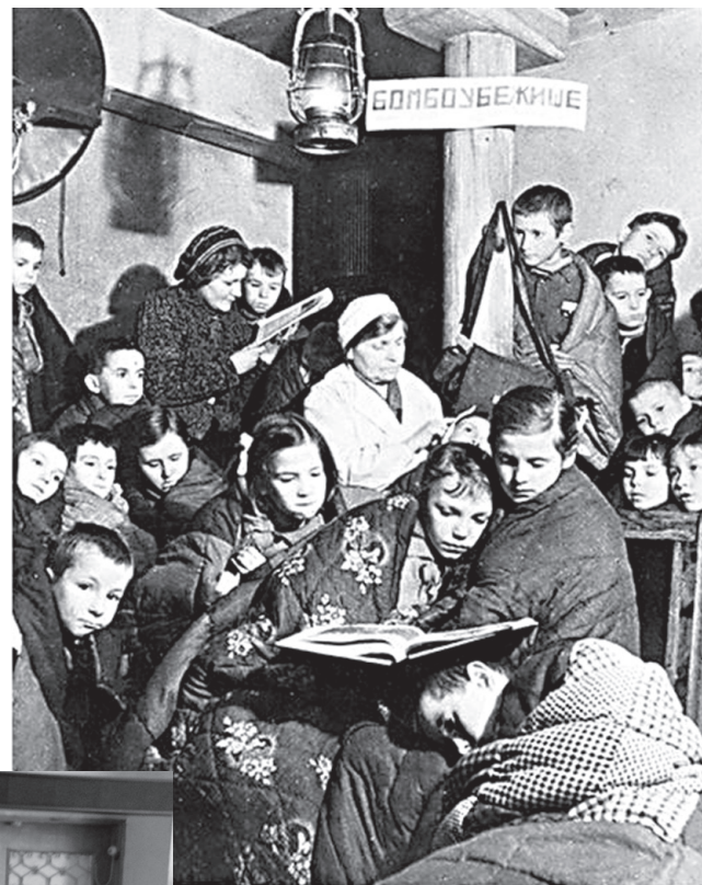
Урок в бомбоубежище

“ 27 января 2019 года исполнилось ровно 75 лет со дня снятия блокады Ленинграда. Вспомним это страшное время.