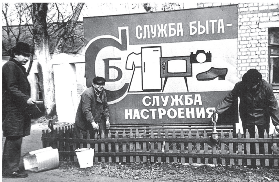
Бытовики на субботнике

В 1991 году управление было переименовано в районное производственное объединение бытового обслуживания населения (РПО БОН). Цеха и службы бытового обслуживания располагались в двух 2-этажных зданиях в райцентре, а в каждом центральном селе района функционировали комплексные приёмные пункты бытового обслуживания. Обращаясь в диспетчерскую службы управления, каждый гражданин мог получить консультацию и услугу по любому бытовому вопросу. Зачастую ему не нужно было куда-то ехать, всё сдавалось или доставлялось в сельский приёмный пункт семи специализированными машинами. Здесь же располагались примерочные для клиентов, пользующихся услугами швейных цехов. Ежедневно на село выезжала целая бригада в составе телемастера, мастера по бытовой технике, часовщика и закройщика. Всё, что можно, ремонтировалось на месте, более сложное забиралось в Прохоровку. Очень многое ре-