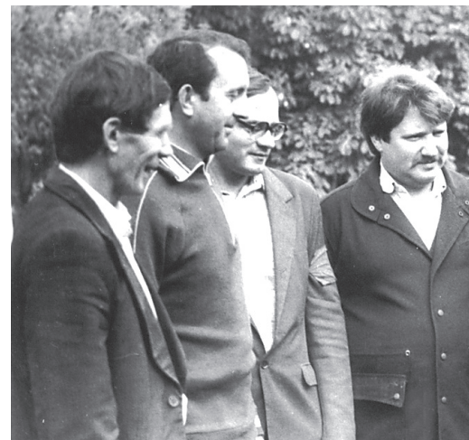
Инструктаж перед выходом народной дружины на субботник (справа)

В 1992 году в связи с Указом Президента РФ о коммерциализации предприятий бытового обслуживания районное производственное объединение было переименовано в производственно-