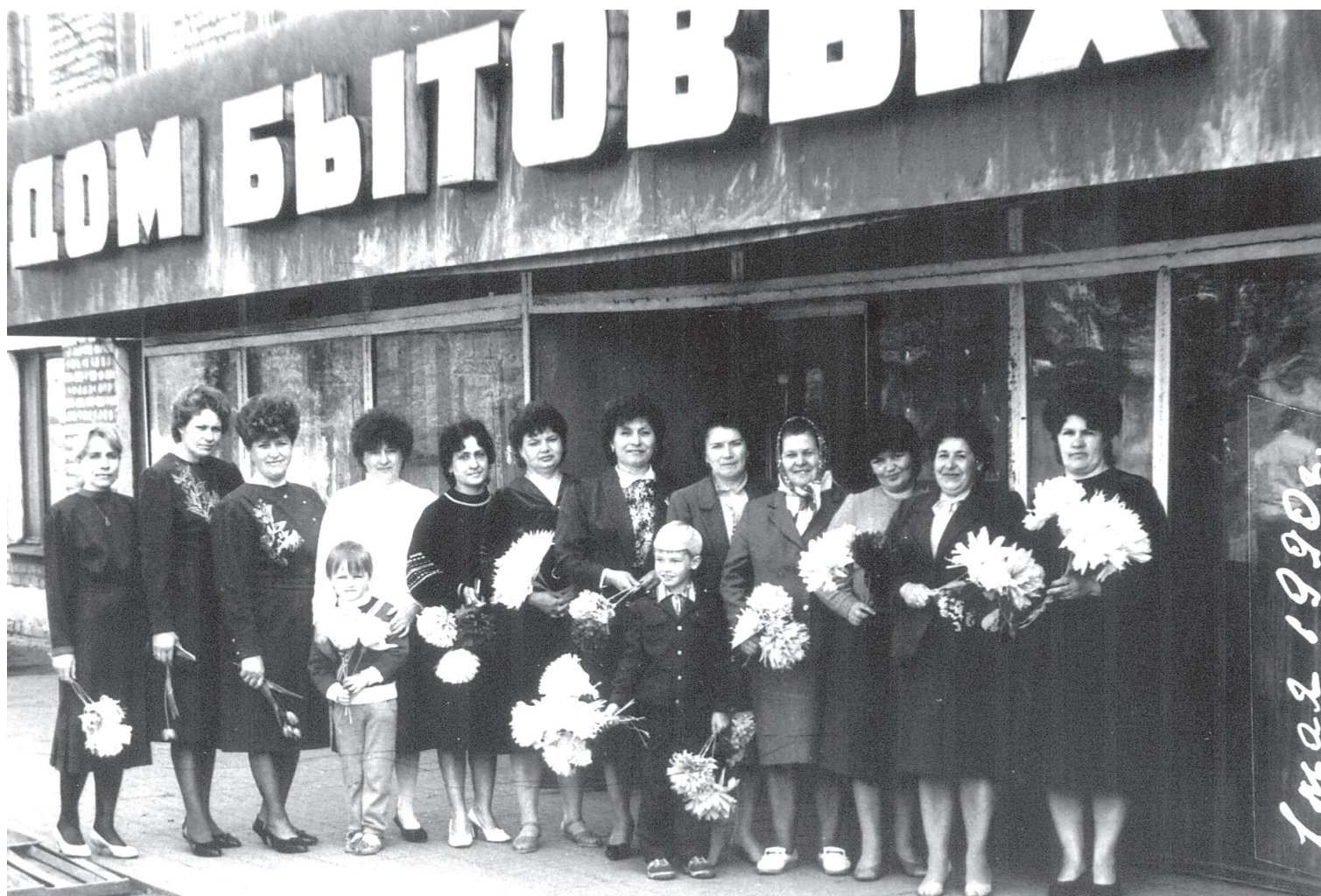
Женский коллектив управления перед первомайской демонстрацией