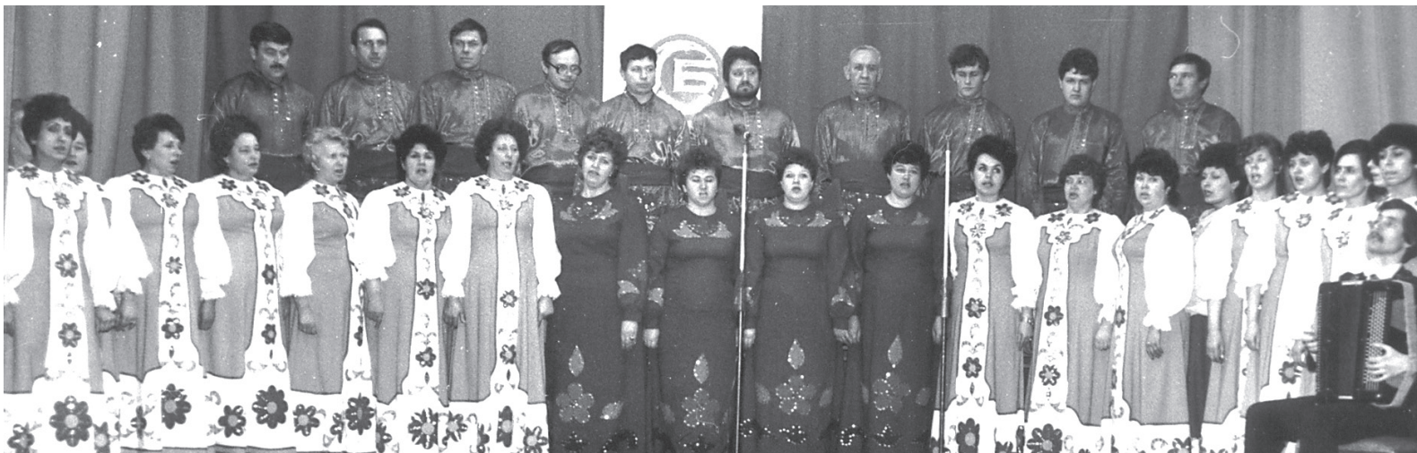
Творческий отчётный концерт управления на районном смотре художественной самодеятельности