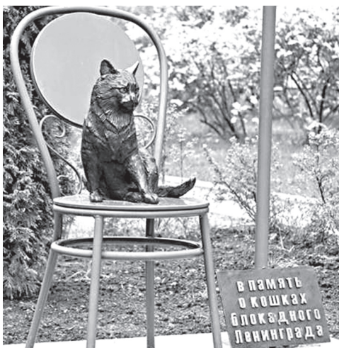
Памятник кошкам блокадного Ленинграда

В осажденном городе работали 30 школ. Местом учебы стали и некоторые бомбоубежища жилых зданий. В помещениях, где проводились занятия, стоял такой мороз, что замерзали чернила.