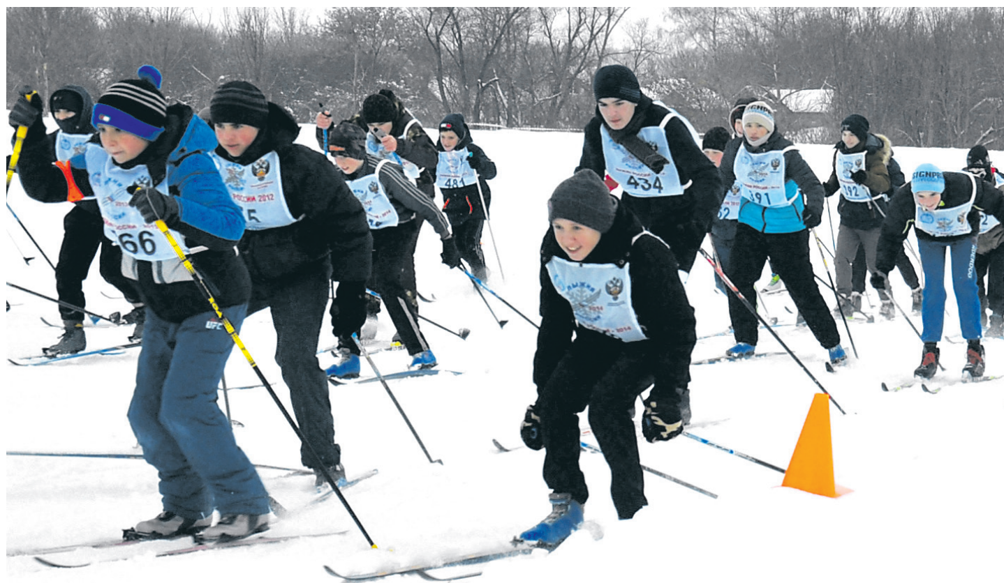
Стартует очередная группа участников кросса