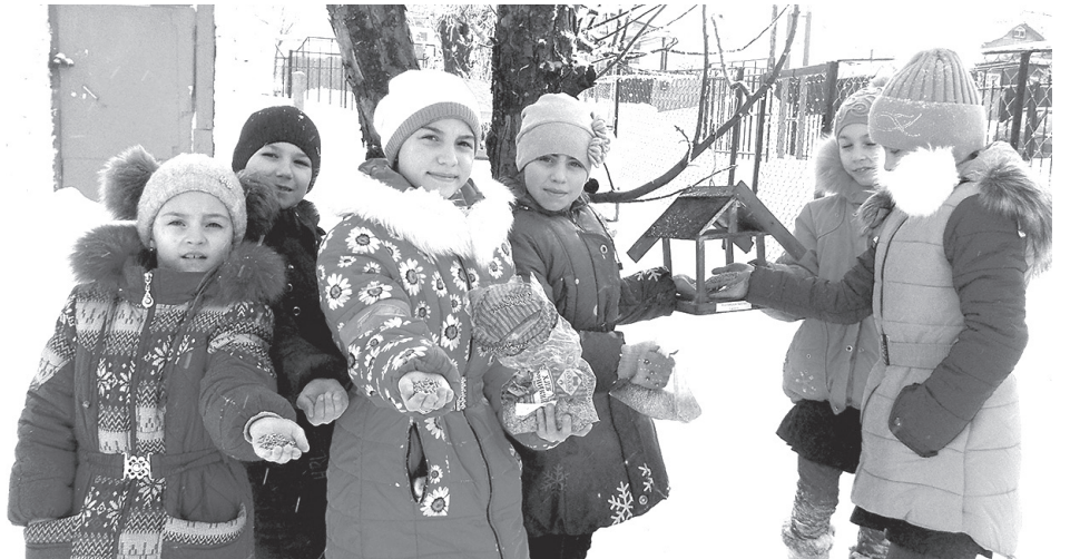
Юные участники акции принесли пернатым друзьям корм

Школьники уже проделали большую работу по спасению наших пернатых друзей. Вместе с педагогами и родителями учащиеся изготовили более 500 кормушек и разместили их на территориях школ и поселений, регулярно подкармливают птиц. Эта работа приносит ребятам большую радость и удовлетворение.