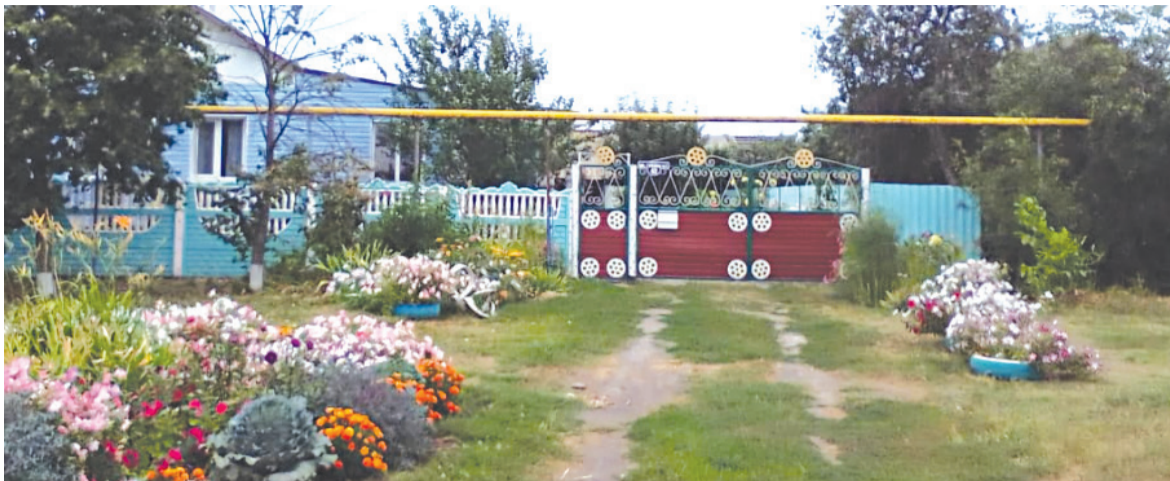
Домовладение Солонарь на ул. Губина, 42

Материалы для публикации предоставлены администрацией Вязовского сельского поселения.