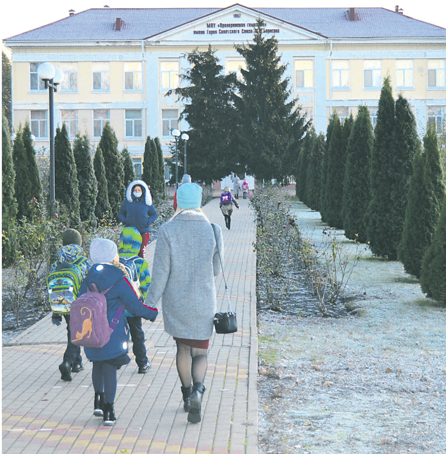
Школьники спешат в Прохоровскую гимназию к первому уроку