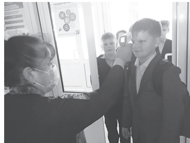
Температурный контроль в Прохоровской гимназии

Кстати, по поводу заболеваемости простудными заболеваниями в образователь-