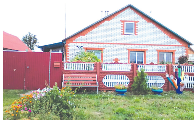
Подворье Катуниных, ул. Каменка