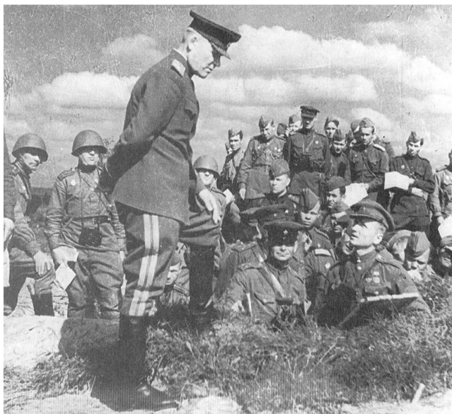
Командующий Степным фронтом генерал-полковник И.С. Конев выступает с разбором тактических учений перед командным составом на полигоне. Конец июля 1943 г.

На снимках альбома видим сожжённые сёла и хутора, наш родной Белгород и Курск в руинах. И женщина после бомбёжки стоит на пепелище родного дома на фоне торчащих труб (Поныри Курской области), а старик плачет тоже на пепелище (Белгород). Вот уж фашисты «постарались» и, наверное, злорадствовали, когда снимали эти страшные кадры (фото трофейные).