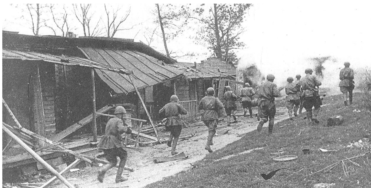
Рота автоматчиков 93 гв. стрелковой дивизии 69 армии ведёт бой на подступах к Белгороду. Степной фронт. Август 1943 г.