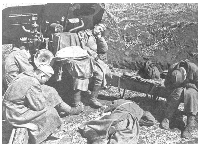
Расчёт 76-мм пушки отдыхает у орудия в перерыве между боями. Июль 1943 г.

Какое сердце не содрогнётся, глядя на фото, отражающие захоронение после боя погибших товарищей и... салют из орудий - последняя дань (дружью) воинам-героям. Тыл, как мог тогда, в огненные годы, помогал фронту. Об этом вам расскажут фото: как колхозники рыли окопы перед Прохоровским сражением, как под обстрелами врага строили железную дорогу Ржава - Старый Оскол, «Жители одного из сёл Курской области стирают бельё для раненых солдат», «Женщины пекут хлеб для бойцов».