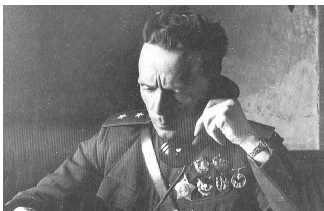
Командующий 65-й армией генерал-лейтенант П.И. Батов за работой на командном пункте армии. Август 1943 г.