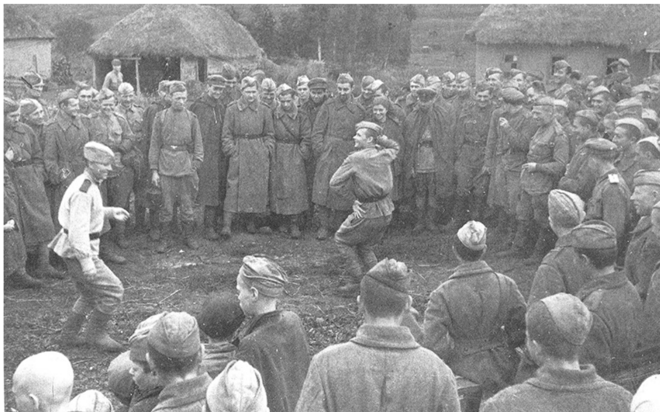
Выступление оркестра музыкальных инструментов 16-й литовской стрелковой дивизии 48 армии в освобождённом селе. Центральный фронт. Июль 1943 г.