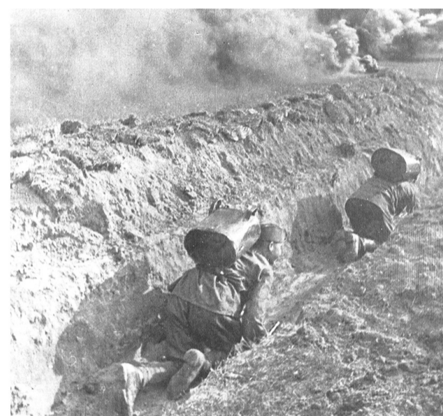
Доставка пищи на передний край 5-й стрелковой дивизии в районе Орла. 63-я армия. Брянский фронт. Август 1943 г. (КОКМ)

раненого бойца. А рядом с нею её подружка. Они эвакуируют раненых в районе Курска. Новое и удивительное узнаёшь по фото о войне, а именно: отряд санитарных собак - на привале перед загрузкой раненых... И такое было на поле боя... Ранее мне думалось, что повара редко погибают на войне, им можно не рисковать. Но вот потрясающий снимок с подписью: «Доставка пищи, 5-я стрелковая дивизия. Передний край. Орловское направление». Ползком под огнём противника, а на спине у поваров баки с горячей пищей. Бой идёт, а после его окончания где брать силы?! Ведь опять предстоит сражаться, и вот отсюда - риск поваров! В этом их подвиг!..