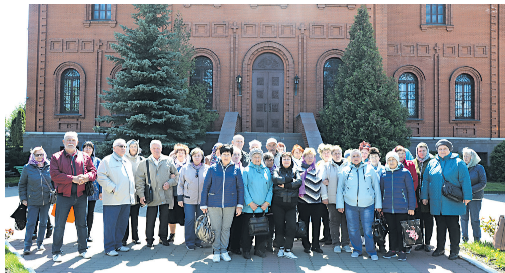
Прохоровцы у Свято-Преображенского кафедрального собора

Последним местом посещения стало священное место для губкинцев - Свято-Преоб-