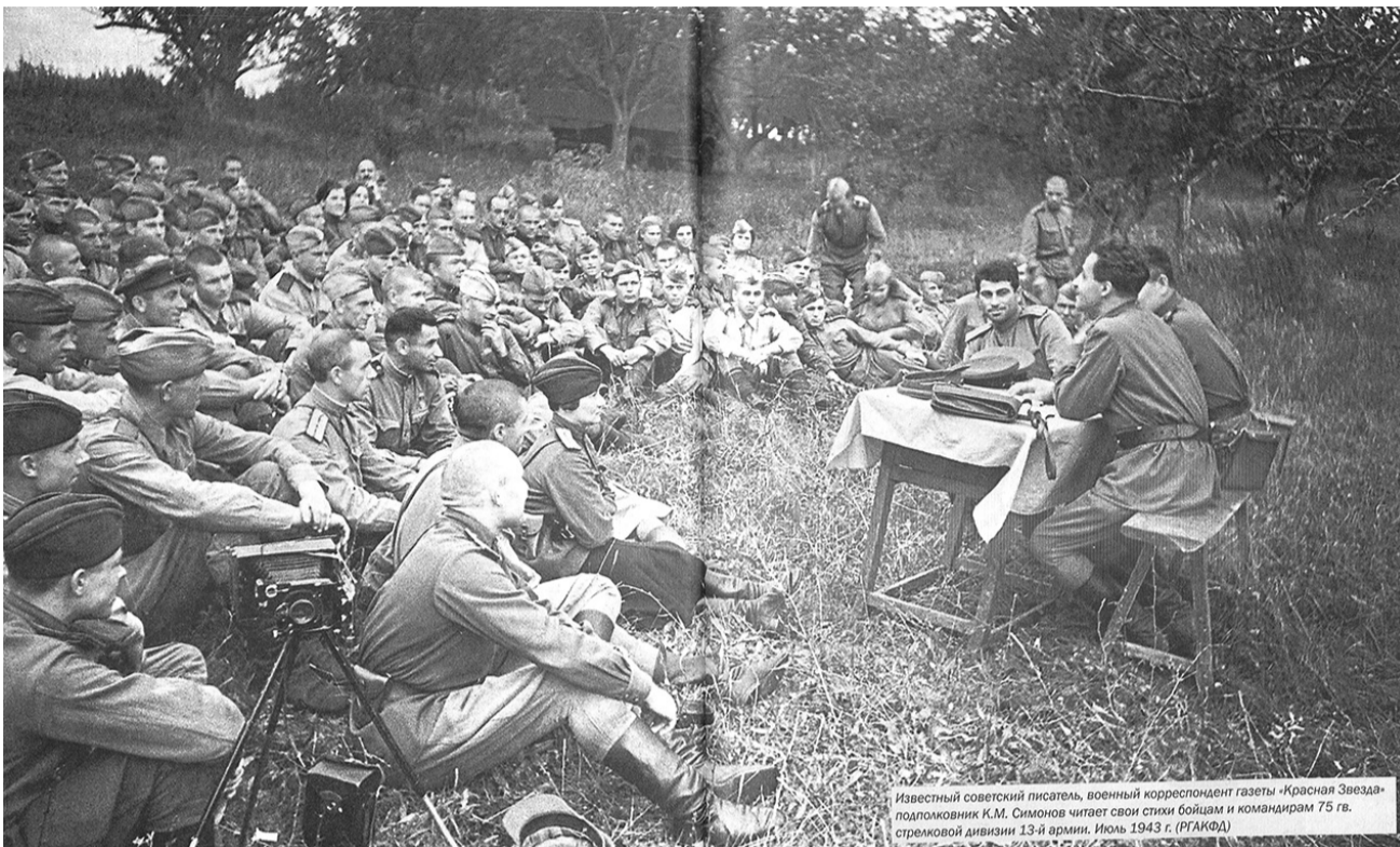
Известный советский поэт, писатель, военный корреспондент газеты «Красная Звезда» подполковник К.М. Симонов читает свои стихи бойцам и командирам 75 гв. стрелковой дивизии 13-й армии. Июль 1943 г.

Как уместно в конце войны звучали слова великого