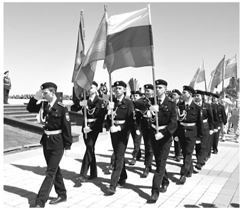
Кадеты Прохоровского района

Этот парад мы посвящаем всем тем, кто воевал здесь в далёком 1943-м году, кто остался жив, и кто остался на этом поле. Его мы посвящаем тем, кто сегодня с оружием в руках участвует в специальной операции на Украине, продолжая подвиги наших дедов и прадедов. И мы должны помнить, что Победа всегда будет за нами, - обратился к участникам и гостям парада В.В. Гладков.