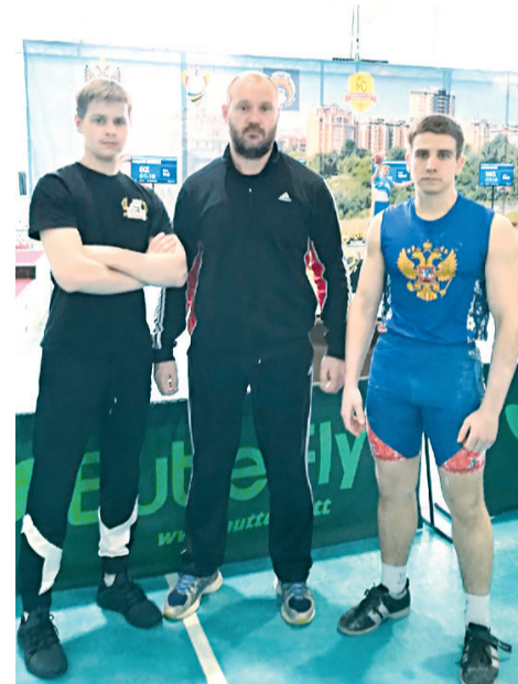
Гиревики с тренером

Ребята подтвердили норматив кандидатов в мастера спорта. А также они получили бесценный соревновательный опыт, который очень пригодится им в будущей спортивной жизни на других соревнованиях.