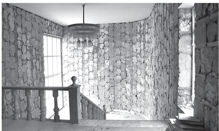
Демонтированы панели стен