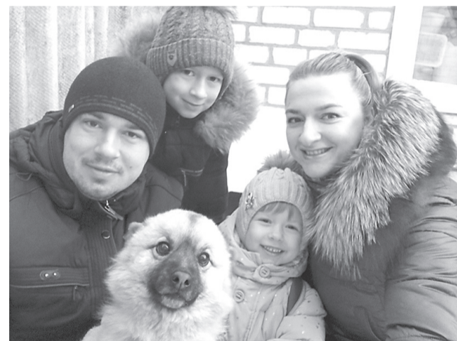
Дружная семья Выдриных со своим любимым питомцем — собачкой по кличке Бублик