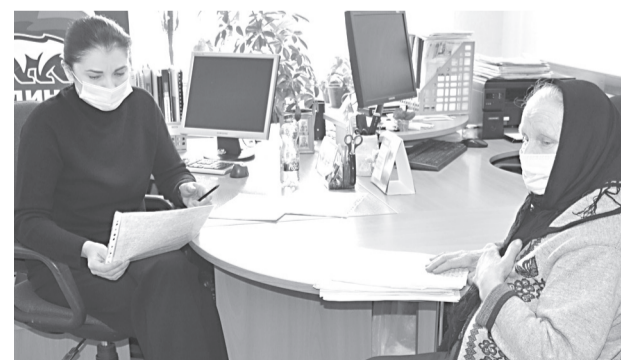
На приёме у депутата жители Прохоровского района

Подводя итоги своей поездки, депутат сказала о том, что сегодняшний визит был весьма плодотворным, ей было приятно побывать в Прохоровском районе ещё раз. А также отметила, что