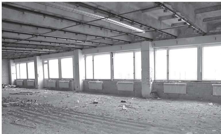
Замена батарей системы отопления 2-го этажа

Летом прошлого года руководством Прохоровского района было решено провести капитальный ремонт РДК, и для этого были изысканы денежные средства согласно утвержденным проекту и смете. Теперь в РДК звучат партии совсем других инструментов — перфораторов, кувалд и «болгарок». Зданию предстоит обновить внешний вид, создать эстетический интерьер внутренних помещений, заменить коммуникации. На сегодняшний день полным ходом идёт замена оконных рам, закончены работы с отоплением и водопроводом, завершается монтаж вентиляции и электропроводки. Работы предстоит много, подрядчики готовятся к ремонту большого зала и перепланировке некоторых помещений. Нужно сделать «с нуля» потолки и полы, заново отделать стены. Ждёт своей очереди и спортзал, в нём тоже предстоит большой ремонт. Так, за ша-