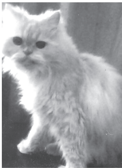
Кот Сазон, 18 лет

С чего все начиналось?.. В подарок мои дети и вну-