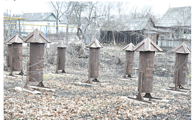
Улья для бортевого пчеловодства

Подготовила О. ДАНЬКОВА.