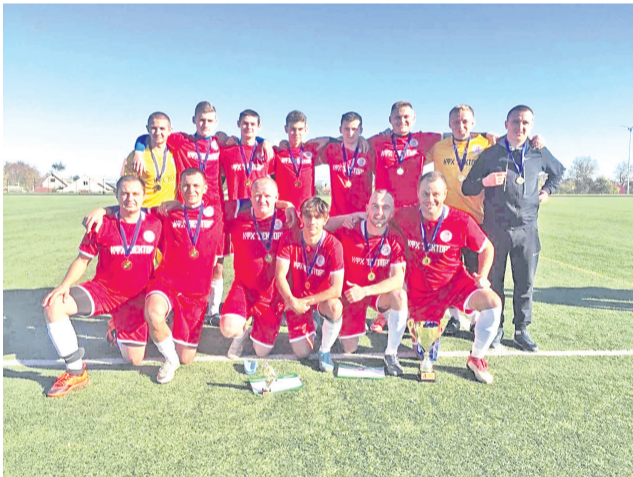
Футбольная команда «Держинец» (с. Беленихино)

8 октября на стадионе «Центральный» в городе Корооче состоялся «ПЕНАЛЬТИ.РФ» - Кубок Белгородской области по футболу среди команд сельских поселений.