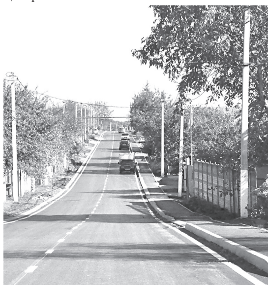
Улица 70 лет Октября в п. Прохоровка

В с. Беленихино отремонтировано 44 м улицы Артельной.