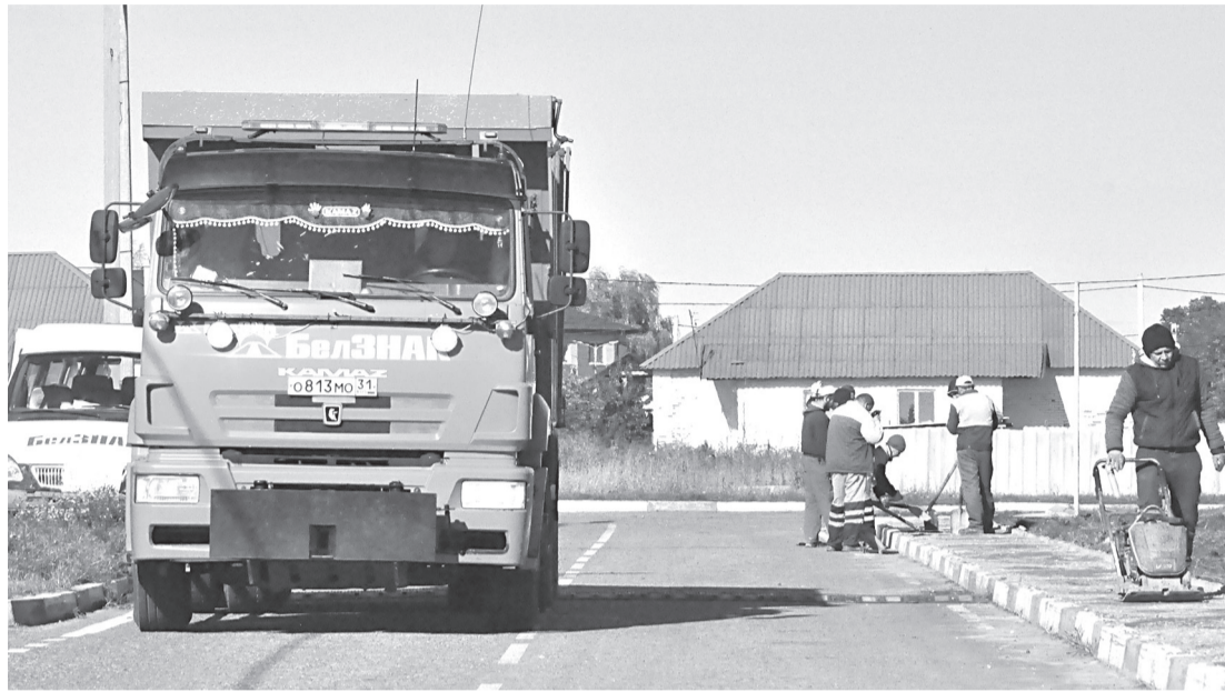
Строительство тротуара и установка дорожных знаков в микрорайоне «Олимпийский»