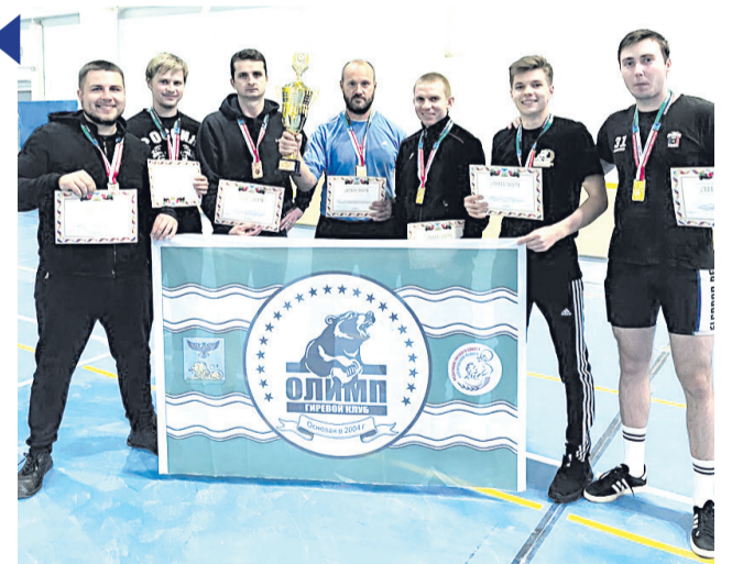
Команда гиревого клуба «Олимп»