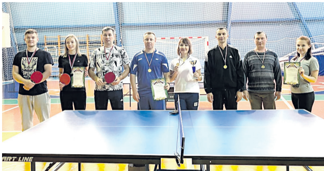
Победители соревнований по настольному теннису

7 октября в п. Прохоровка на базе физкультурно-спортивного комплекса «Олимп» прошли соревнования по настольному теннису в зачёт 16-й спартакиады среди команд трудовых коллективов.