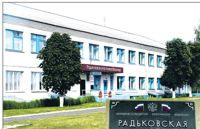
Современное здание Радьковской участковой больницы

Довольно скоро стало очевидно, что необходимо увеличение больницы, так как с каждым годом за помощью обращалось все больше людей, нуждающихся в лечении. И уже в 1905 году, спустя 13 лет с начала работы, в Корочанское уезд-