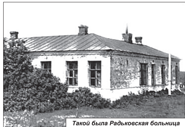
Такой была Радьковская больница

Постановлением Курского губернского земского собрания от 9 декабря 1910 года было разрешено Старооскольскому земству передать Радьковский участок в ведение Корочанского земства на условиях, утвержден-