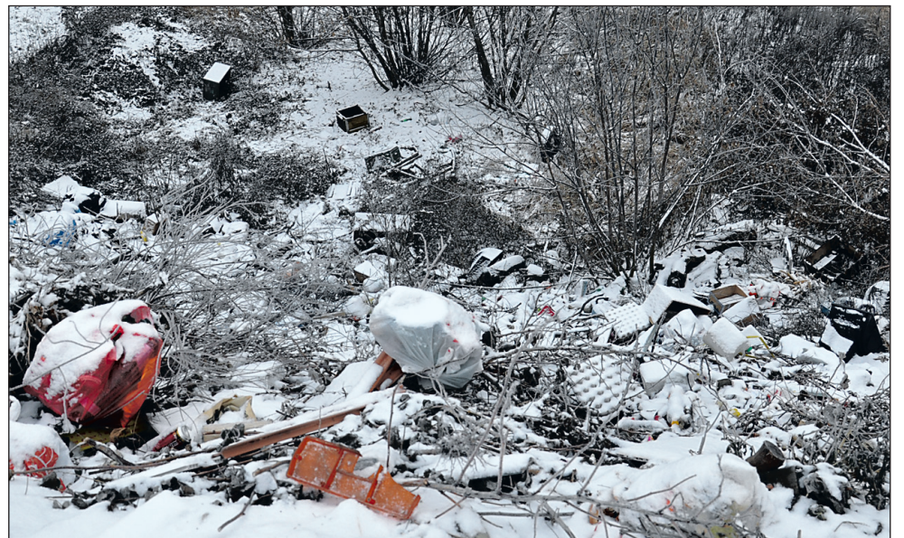
Нашему фотокорреспонденту не составило особого труда, чтобы найти пейзаж, характерный в последнее время для окрестностей не только посёлка, но и многих наших сёл и хуторов. Увы, в лесополосах, балках и оврагах вместо буйства зелени, процветают вот такие «подснежники». К весне их ожидается всё больше. Потому наряду с систематизацией обращения с отходами, видимо, следует кроме стимулов применять и санкции к «утилизаторам» мусора таким вот образом... (Фото Р. ДЁМИНА).

те мне, платящую за вывоз мусора, расчёты, сравнивающие загрязнения атмосферы выхлопными газами автомобилей и теми загрязнениями, которые произвожу я, сжигая бытовой мусор на месте. Сомневаюсь, что такие расчёты существуют, потому что в них никто не заинтересован. Ведь речь идет о собираемых с населения миллиардах. Кто же от них откажется?