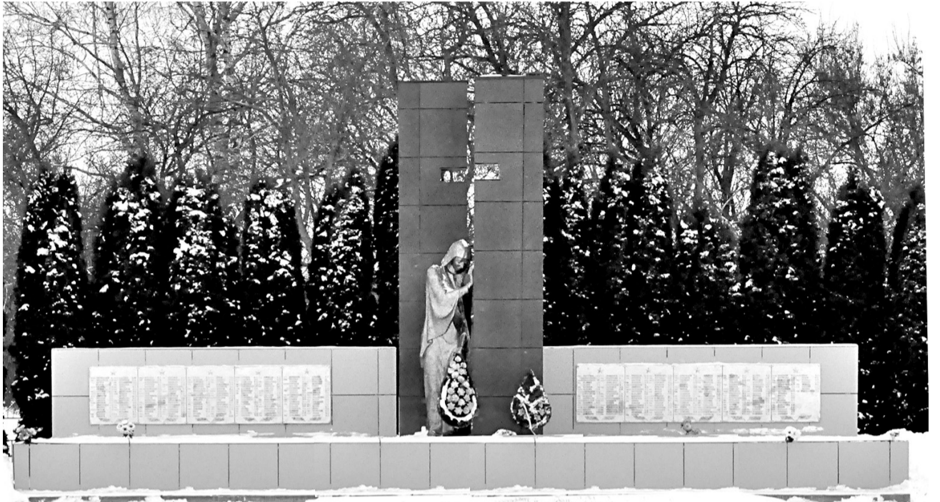
Мемориал на братской могиле в с. Гусёк - Погореловка