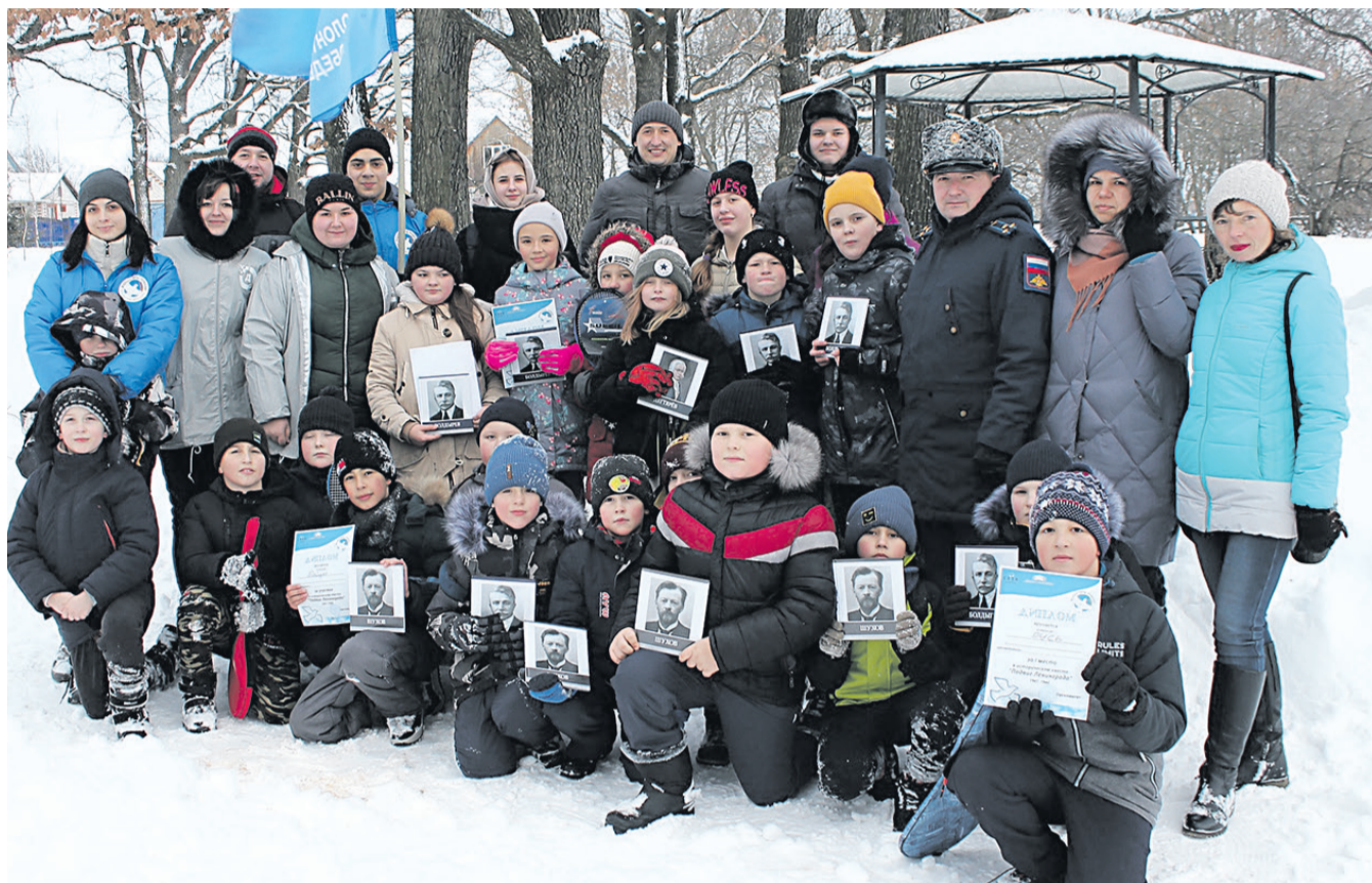
Сотрудники библиотеки Н.И. Рыжкова, работники ЦМИ с воспитанниками спортивно-патриотического клуба «Русь»

Команды-победительницы получили грамоты, а все участники - призы от ЦМИ «Мир». Организаторы отметили: их по-