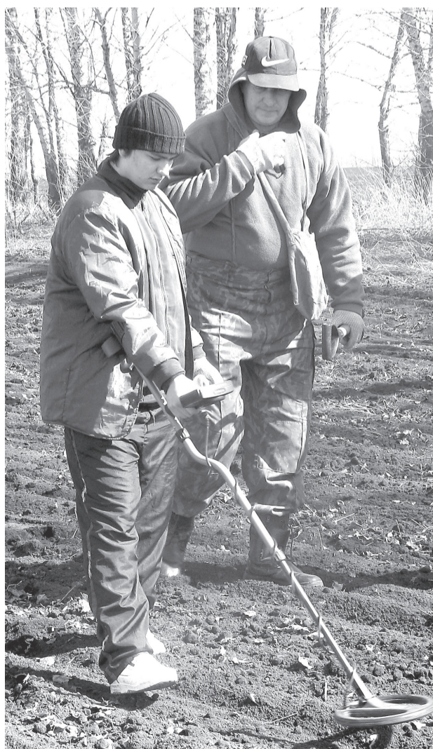
Совместная работа юных и взрослых поисковиков

Изучая экспозиции музея, учащиеся знакомятся с редкими экспонатами, узнают о жизни и делах земляков, проникаются любовью к родным местам. Туристические походы, экскурсии, без которых немислимо краеведение, воспитывают в учащихся любознательность, выносливость, находчивость, прививают им чувство коллективизма, учат взаимовыручке. И это даёт результаты, ведь совсем не случайно за последние 3-4 года количество экспонатов музея резко возросло. Работа нашего музея – живое творческое дело. Она призвана воспитывать в молодежи дух патриотизма, любви к