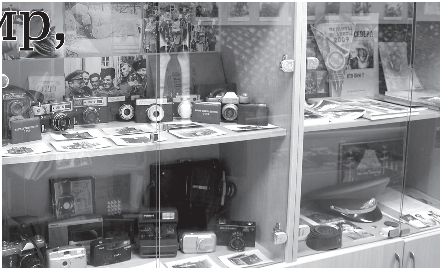
Одна из новых экспозиций

В 2010 году музей гимназии стал победителем областного конкурса «Лучший экспонат школьного музея», а в 2013 призёром областного конкурса «Сохраним культурное наследие региона» в номинации «Лучшая выставка-экскурсия». В 2015 году по итогам областного смотра-конкурса школьных краеведческих музеев, посвящённого 100-летию Первой мировой войны, вошёл в десятку лучших музеев области, а в 2016 году стал призёром областного смотра-конкурса школьных краеведческих музеев, посвящённого 70-летию Великой Победы. Историко-краеведческий музей Прохоровской гимназии неоднократно становился победителем и призёром районных смотров-конкурсов школьных музеев.