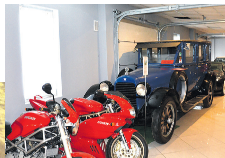
В музее комплекса