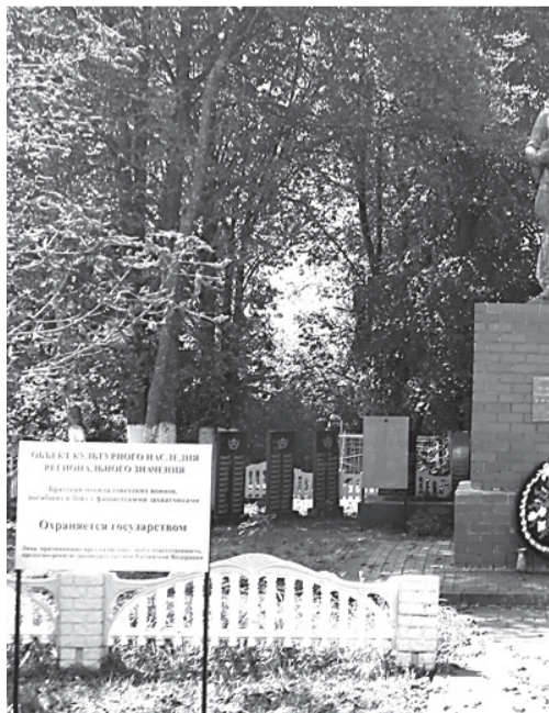
Братская могила в селе Красное