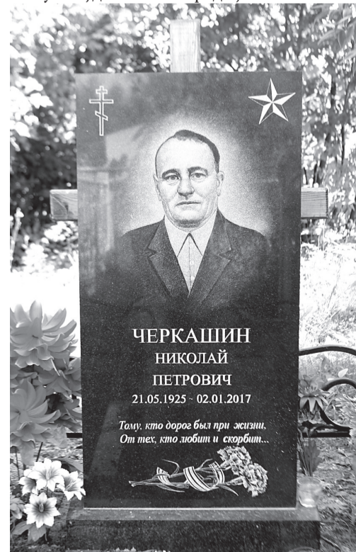
Памятник селькору Николаю Петровичу Черкашину