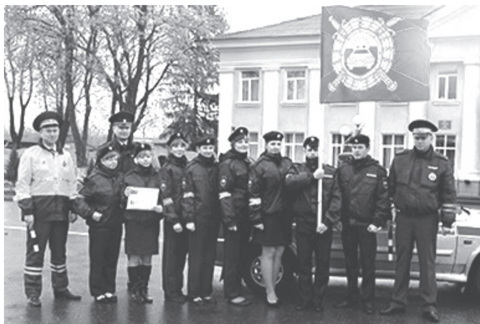
Кадетский класс ГИБДД Прелестненской средней школы и сотрудники госавтоинспекции

Проведено 114 лекций-бесед, направленных на профилактику ДТП: из них 75