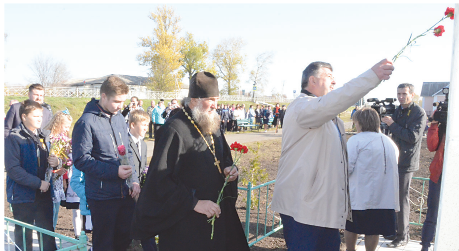
Цветы к стене с фамилиями погибших земляков