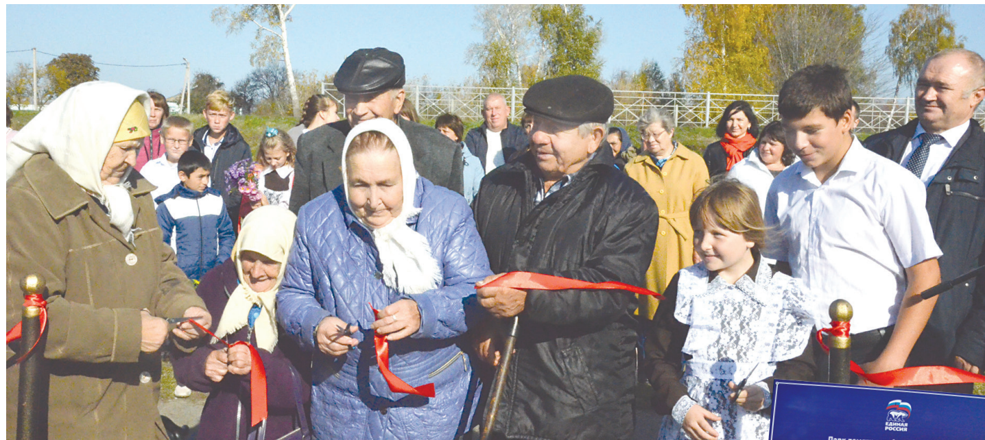
Участники торжества перерезают символичную красную ленточку