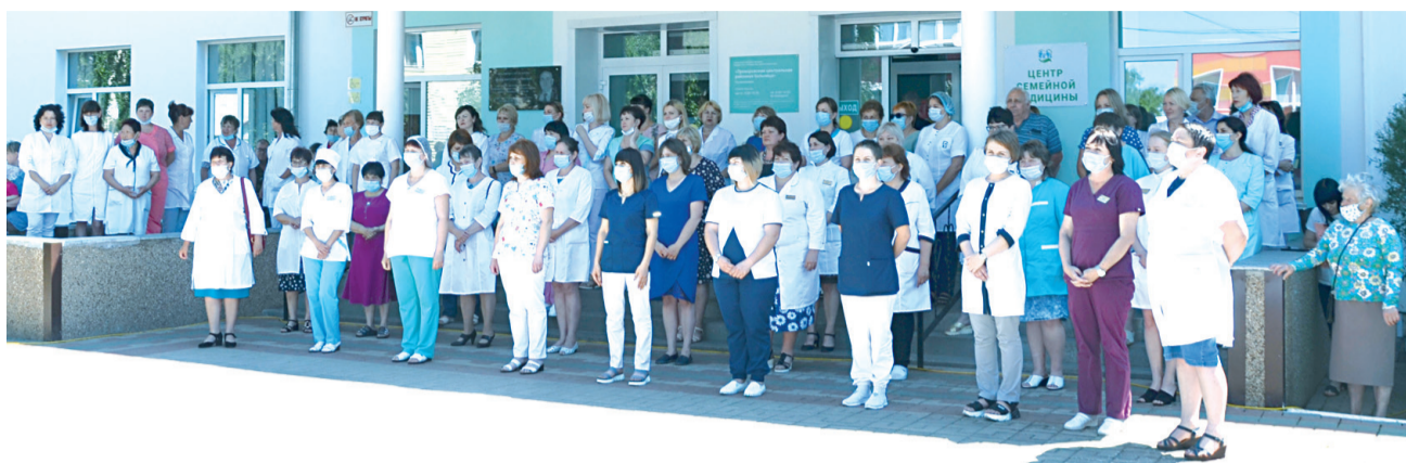
Медицинские сотрудники Прохоровского района