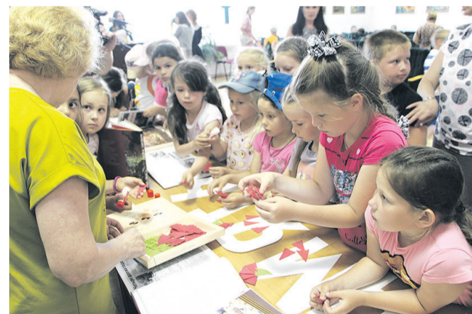
Дети делают гирлянду из бумажных гвоздик