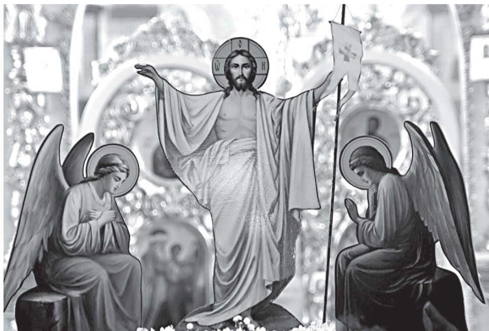
Христос Воскресе! Дорогие прохоровцы!

От сердца, исполненного светлой радости о Воскресшем Спасителе, всех вас поздравляю с праздником праздников — Пасхой Господней!