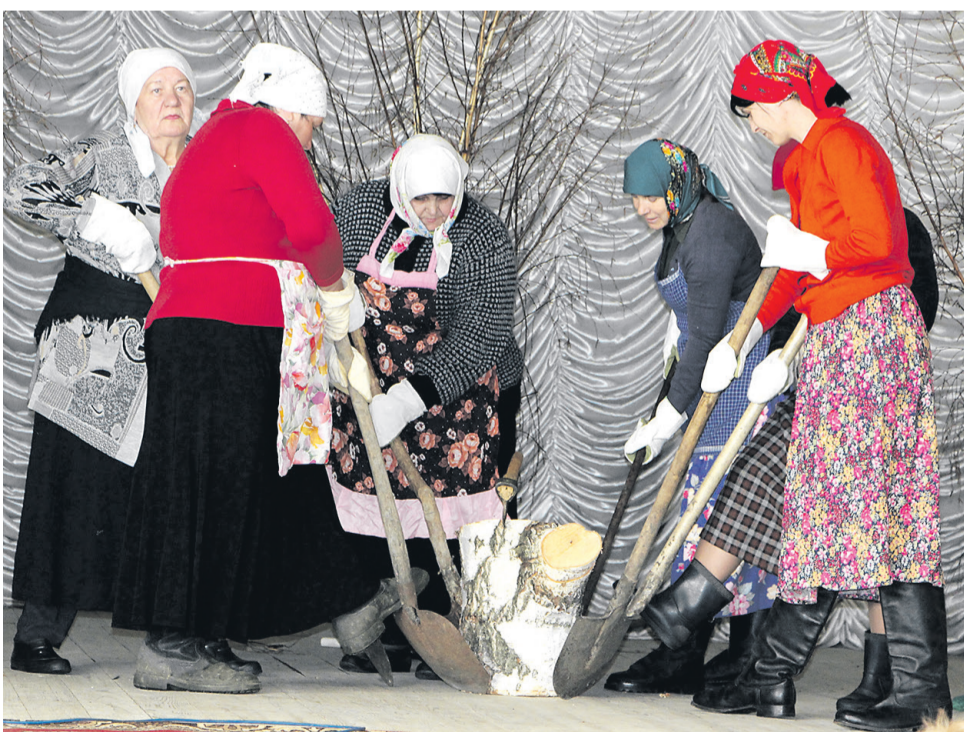
Постановка Береговского сельского Дома культуры