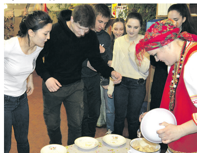
Вареники от Солохи