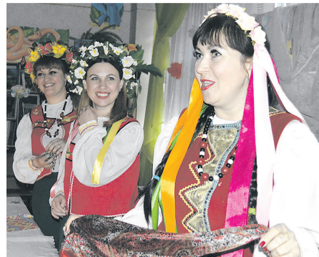
Персонажи из Диканьки