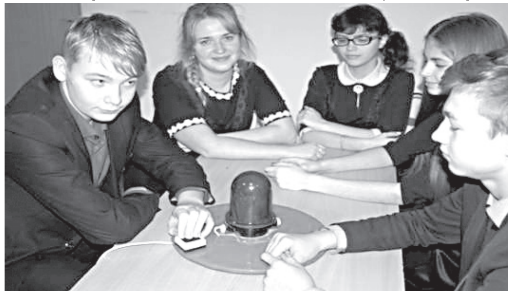
Работа в команде - залог успеха

Одним из наглядных примеров социализации детей является организация и проведение предвыборной кампании и выборов председателя Большого Совета ДПО «Славянка». Это ежегодное мероприятие стало очень популярным среди детей. Они чувствуют независимость, потребность личного участия, понимают важность и ответственность проявленной инициативы и стараются сделать правильный выбор.