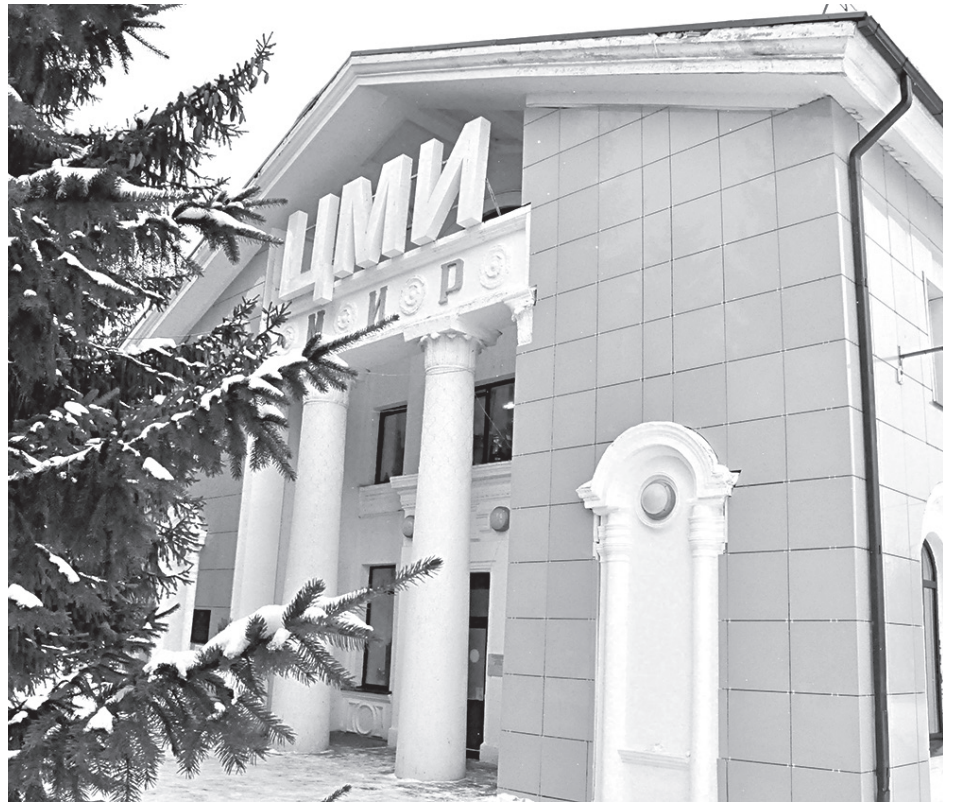
Центр молодёжных инициатив «МИР» торжественно открылся в п. Прохоровка 2 февраля 2017 года. Это современное пространство для прохоровской молодёжи, где обитает особый дух здорового лидерства.

ЦМИ эффективно сотрудничает с социальными службами, центром занятости, учреждениями образования, культуры, спорта, лечебными учреждениями для наиболее полного развития и удовлетворения творческого потенциала молодёжи, становления личности, снижения негативных проявлений в их среде. Учитывая интересы и потребности различных групп молодёжи, специалисты центра участвуют в разработке и реализации проектов, приоритетных направлений государственной молодёжной политики, обеспечивают молодых людей информацией о перспективах и законных направлениях своей деятельности: самореализации в труде, учёбе, досуге, увлечениях, по всему спектру вопросов жизни молодёжи в области (здоровье, спорт, образование, жильё, досуг, труд, карьера, общественная и личная жизнь, семья, международные отношения и международные обмены). Кроме того, ЦМИ оказывает поддержку талантливой и инициативной молодёжи, вовлекает в социальную практику, привлекает к участию в выборах законодательных органов власти, к добровольческому труду, массовым спортивным акциям, туризму, помогает молодым людям рационально использовать свободное время для отдыха и расширения культурного кругозора.